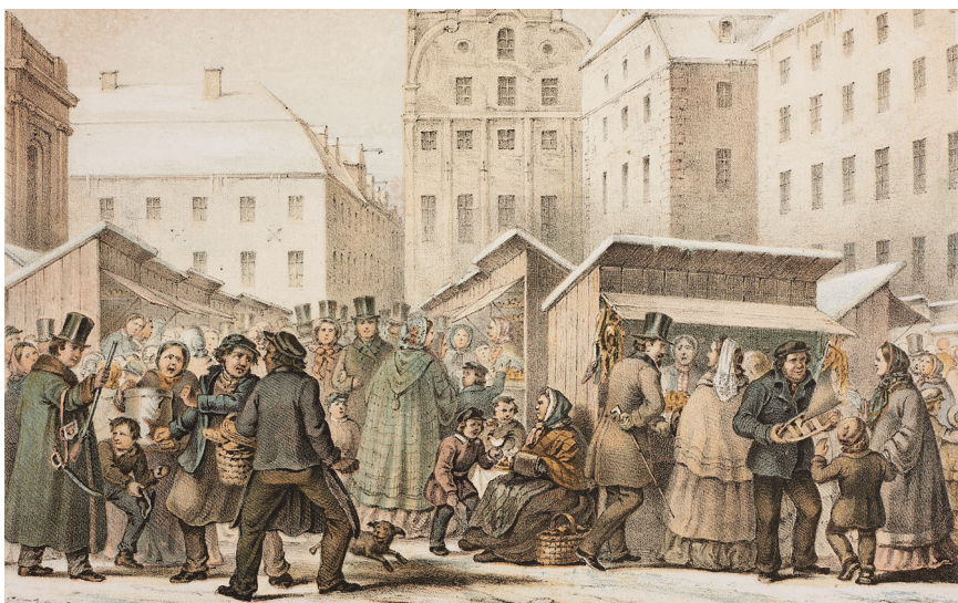
Julmarknaden på Stortorget i Stockholm, ur Litografiskt Allehanda , 1859.

läsning och läsningens dåliga respektive goda värden som pågick i samtiden. Där möttes motsatserna manligt–kvinnligt, mödosamt–lustfyllt, beständigt–flyktigt, lärande–underhållande och, sist men inte minst litterär–bildande kontra fiktion–populär. 27