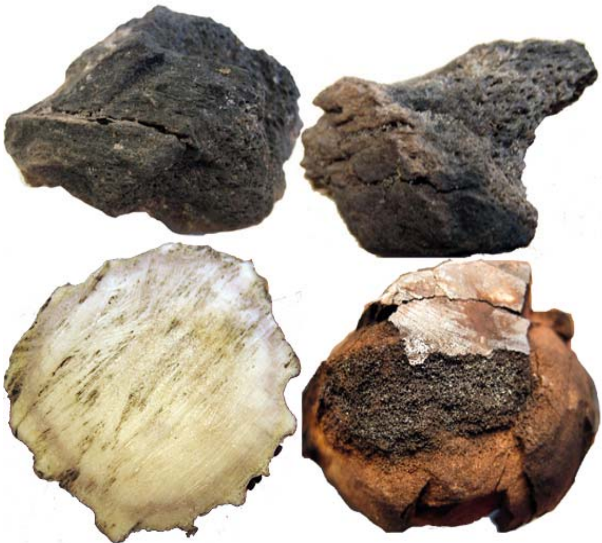
Figur 3 Jämförelse med brända älghorn från Fotingen överst kontext B4 t.v. B8 t.h. och färskt älghorn nederst t.v. obränt, t.h. bränt. Notera hur framträdande spongiosan ter sig i de brända hornen.

Med anledning av svårigheterna att identifiera små fragment av brända horn har jag utfört försök på färsk horn från olika hjortdjur. Hornen har svetts i en eldstad under varierad tid för att se hur strukturerna framträder och förändras med bränningstid och temperatur. I figur 3 nedan visas exempel på hur spongiosan i älghorn framträder i och med förbränning. Det har dock inte gått att simulera den ytterligare uppluckringen som sker av lamellerna, eller nedbrytning av ytskiktet, som sker med lång tid i jorden.