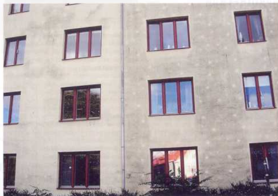
Bild 2: Fasad på byggnad i Kristianstad. Högra hälften har kraftig påväxt och vita prickar syns. Vänstra hälften har nästan ingen påväxt.

De första delresultaten från mätningar under våren visar att temperaturvariationerna i tunnputs på isolering är betydligt större än i en tegelfasad. De största dygnsvariationerna fanns i tunnputsfasaden i söderläge med röd kulör. Yttertemperaturen på fasaden varierade mellan -2^{\circ}\text{C} och +53^{\circ}\text{C} . Tunnputsfasaden uppvisade också den största temperaturskillnaden mellan ytan och luften. På den vita lättfasaden i söderläge var temperaturen lika låg på natten, men uppnådde bara +28^{\circ}\text{C} på dagen. Som jämförelse blev temperaturen på tegelfasaden i söderläge maximalt +37^{\circ}\text{C} på den röda halvan och +22^{\circ}\text{C} på den vita halvan. När yttertemperaturen är lägre än lufttemperaturen, vilket främst inträffar under nattetid, blir den relativa fuktigheten i fasadytan hög. Detta kan medföra kondens på fasadytan och risken för biologisk påväxt är då mycket stor. Vid senare tillfällen, under hösten, har