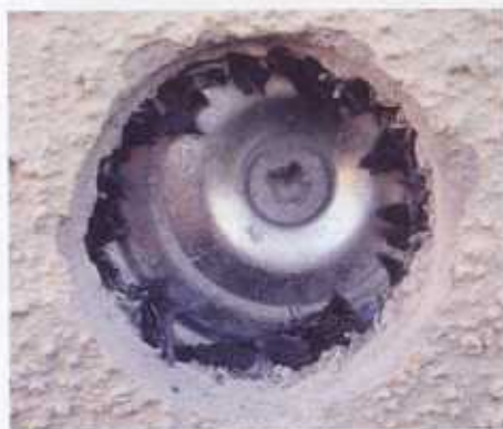
Bild 4: Utborrning av putsen vid en "vita prick". En metall kramla syns bakom putsen.

Mögelsvampar är beroende av en organisk kolkälla och måste därför hitta organiskt material från underlaget för att kunna växa.