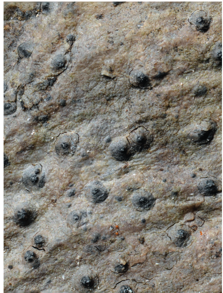
Fig. 8. Thelidium pluvium .

landet tidigare okänd art, nämligen Thelidium pluvium (Fig. 7), som var en av pyrenokarperna som Ulf samlade in. Även ett par Verrucaria -arter fanns i insamlingarna, men någon säker bestämning har inte kunnat göras. En av kollekterna visar på stora likheter med V. hydrophila , men det finns stora oklarheter runt användningen av det namnet. Både rosenporina Porina lectissima och den mer allmänna arten skuggvärtlav Pseudosagedia chlorotica noterades på de fuktiga väggarna. En sorediös art visade sig vara Porpidia soredizodes som är ny för Småland. På en gran satt sedan bärdlav Nephroma parile , vilket kändes som ett udda fynd brottet. Avslutningsvis kan nämnas gytterlav Protopannaria pezizoides på en bergvägg. Hörnebo var kanske inte så artrikt men några pärlor fanns där trots allt.