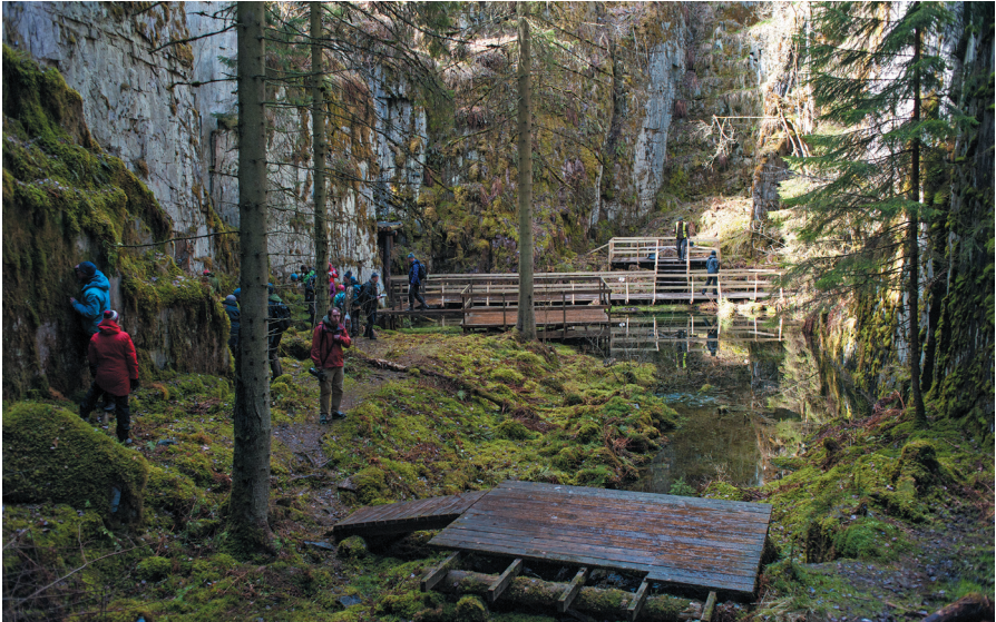
Fig. 7. Nere i Hörnebo gamla skifferbrott med mycket mossa.

landet tidigare okänd art, nämligen Thelidium pluvium (Fig. 7), som var en av pyrenokarperna som Ulf samlade in. Även ett par Verrucaria -arter fanns i insamlingarna, men någon säker bestämning har inte kunnat göras. En av kollekterna visar på stora likheter med V. hydrophila , men det finns stora oklarheter runt användningen av det namnet. Både rosenporina Porina lectissima och den mer allmänna arten skuggvärtlav Pseudosagedia chlorotica noterades på de fuktiga väggarna. En sorediös art visade sig vara Porpidia soredizodes som är ny för Småland. På en gran satt sedan bärdlav Nephroma parile , vilket kändes som ett udda fynd brottet. Avslutningsvis kan nämnas gytterlav Protopannaria pezizoides på en bergvägg. Hörnebo var kanske inte så artrikt men några pärlor fanns där trots allt.