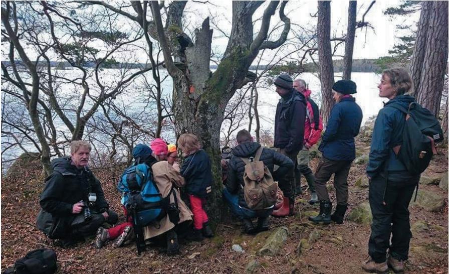
Fig. 5. Samling runt en av alla intressanta bokar i Bjurkärr.