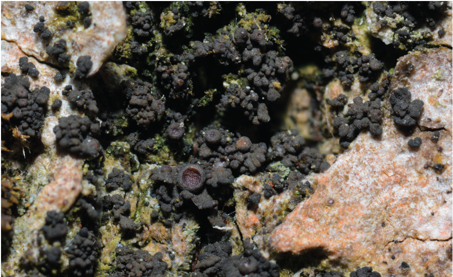
Fig. 4. Rosettgelélav Scytinium fragrans på en bok.

S. leucopoda liten parasitspik. Skillnaderna mellan de båda parasitspikarna är mycket små men vid noga luppande kan man se att liten parasitspik har ett skaft medan kortskaftad parasitspik har ett mycket kort skaft eller inget alls.