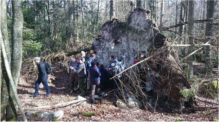
Fig. 3. En stor rotvälta tilldrog sig uppmärksamhet. På den växte bl.a. rotvältedynlav Micarea myriocarpa .

lavar. Bjurkärr är en av landets rikaste områden med avseende på rödlistade lavar. Detta beror på flera samverkande faktorer där skogens långa kontinuitet av gamla bokar och ekar är en av de viktigaste. Skogens gynnsamma läge på en halvö i Åsnen ger ett optimalt mikroklimat och en variation i ljusregimen. Dessutom finns många rötskador som ger ett gynnsamt pH på barken för flera av de rödlistade arterna. Slutligen ger det geografiska läget möjlighet för arter från olika regioner att kolonisera området.