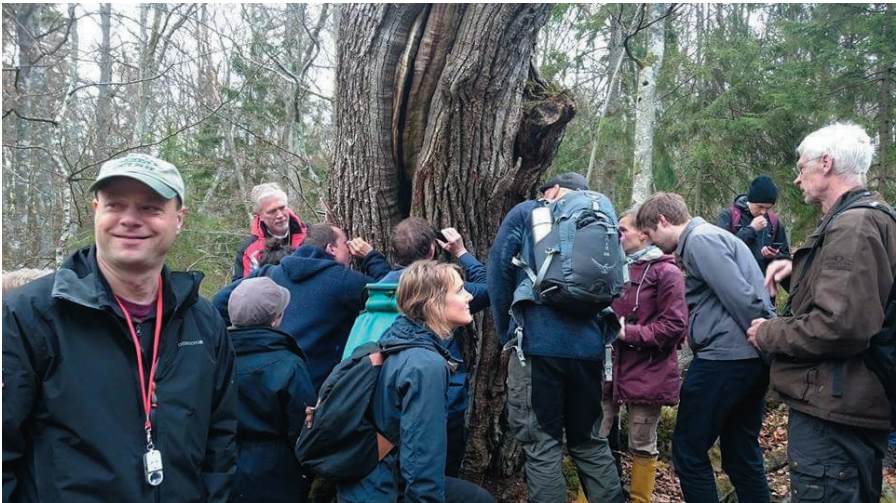
Fig. 2. Det är trångt runt de fina ekarna men värt väntan.

Vid lunch bar det av till Bjurkärr. I denna bokskog finns nära fyrtio rödlistade