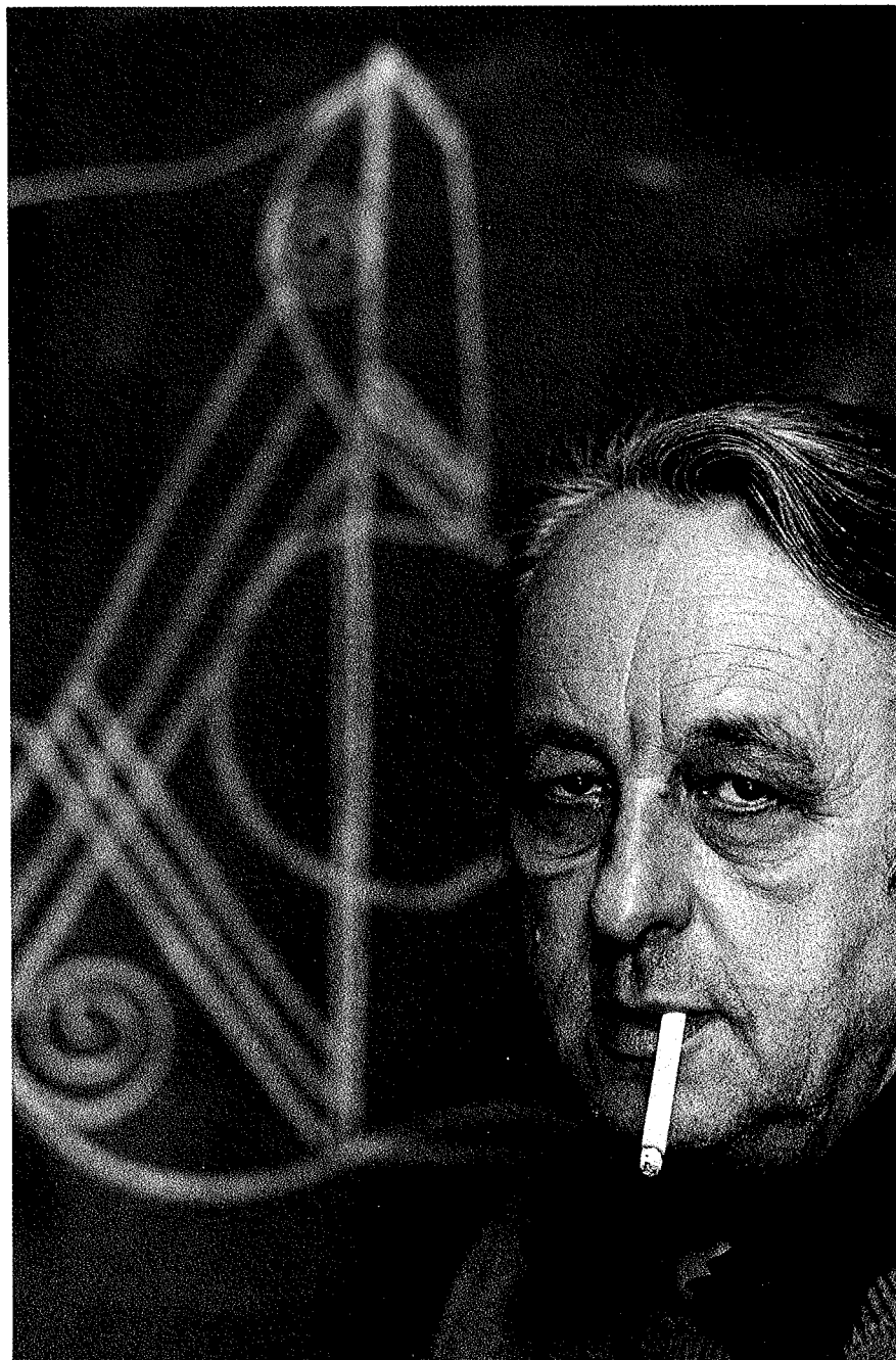
Louis Althusser i maj 1978

Att syftet med boken är att förstå och förklara, snarare än bortförklara, får