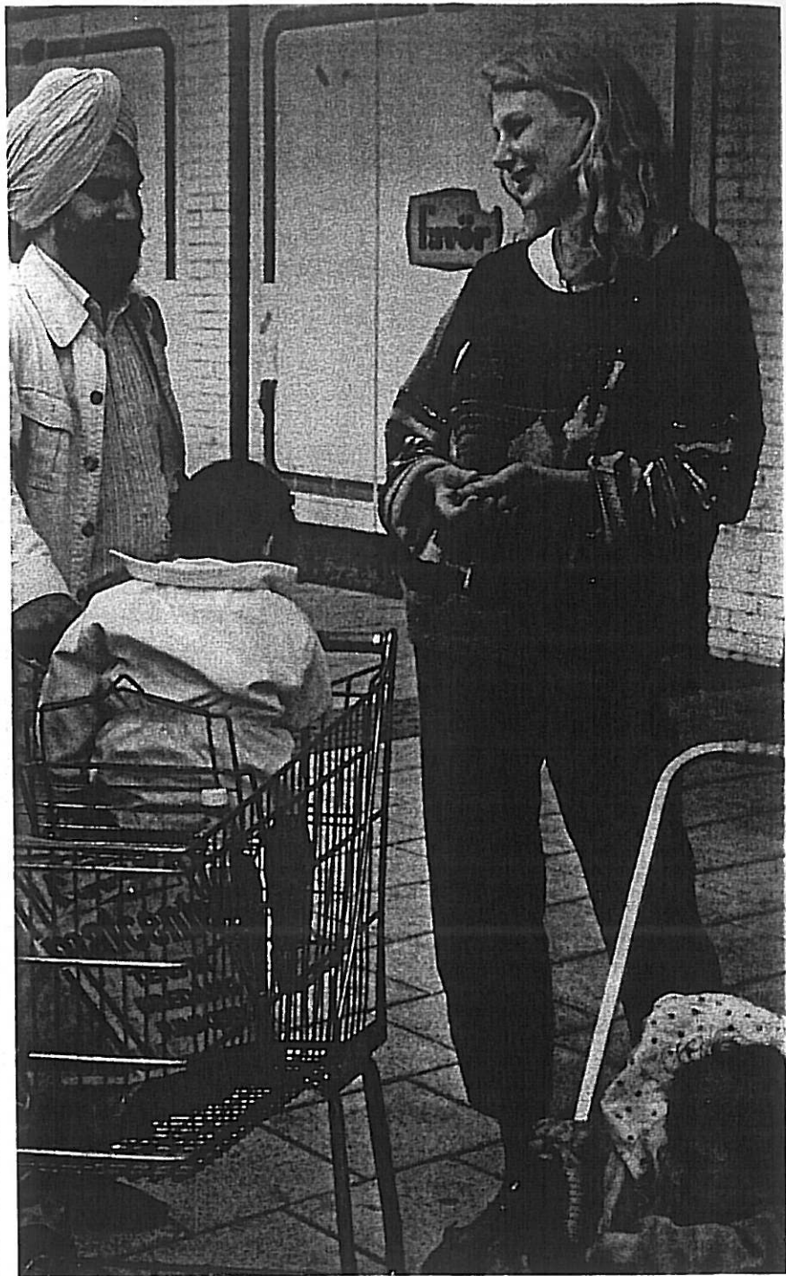
Att samtala är extra viktigt i ett område där människor från många olika kulturer bor.

Ibland kan det i vardagslivet uppstå konflikter som saknar all ekonomisk eller politisk anknytning. Dessa konflikter är produkter av mellanmännskli-