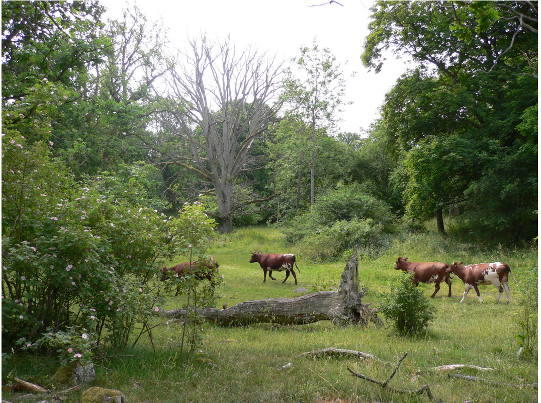
Figur 1. Nötbetad hagmark med gamla ekar, stående döda ekar, eklågor och blommande buskar i Strömsrum, en naturtyp med många hotade arter.

Pasture with old living oaks, standing dead oaks, downed oak logs and flowering shrubs at Strömsrum, a habitat type with many threatened species.