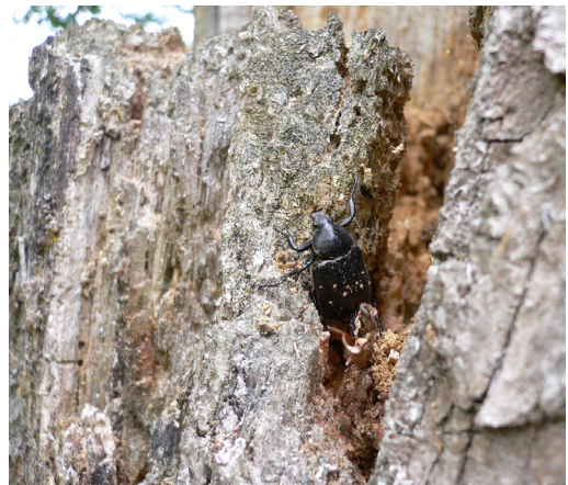
Figur 5. Den svarta guldbaggen Gnorimus variabilis lever främst i gamla döda ekar, både stående och lig-gande.

Allecula rhenana mörkbent kamklobagge. 2002