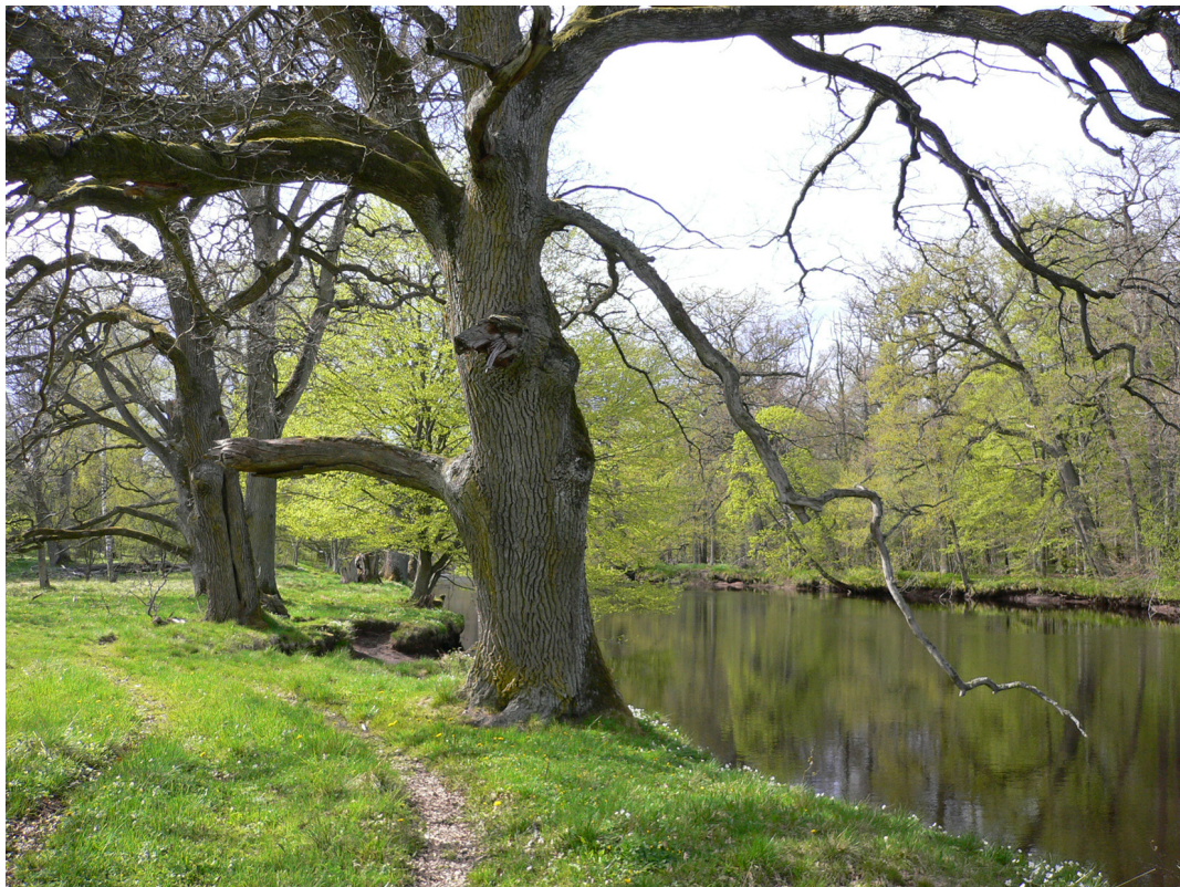
Figur 6. Alsterån passerar Strömsrums hagmarker och sumpskogar, men åns eventuella betydelse för den vedlevande faunan har ännu inte studerats.

The river Alsterån passes through the pastures and riparian forests at Strömsrum, but if the river is important for wood-living species is unknown.