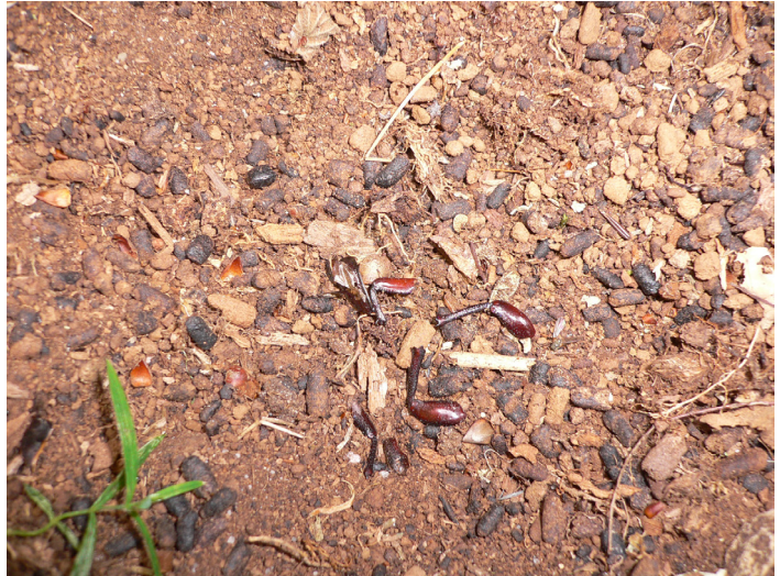
Figur 4. Mulm i ihåliga träd modifieras av läderbaggen Osmoderma eremita , vars spillning är en viktig komponent; de mörka ekollonformade partiklarna.

Wood mould from a hollow oak at Strömsrum with frass of Osmoderma eremita .