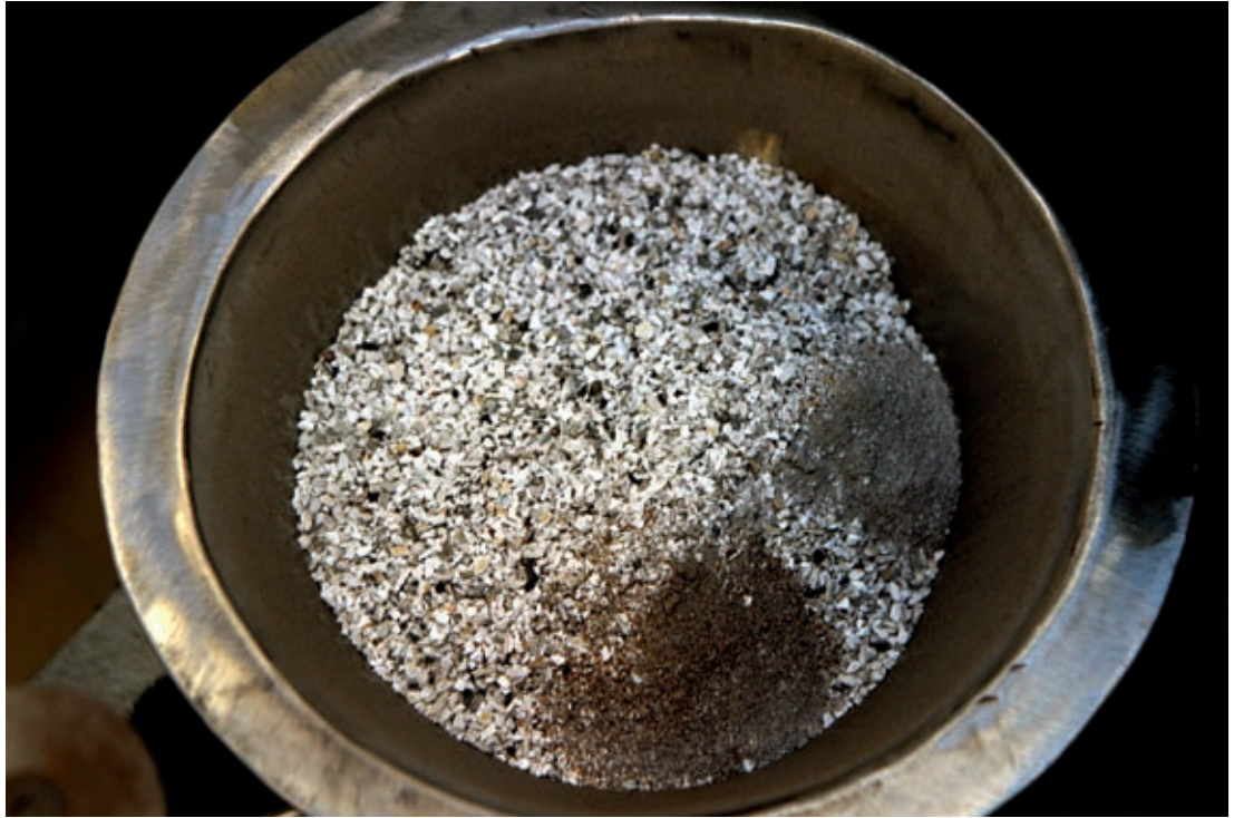
Krematorium, Lund 2005.