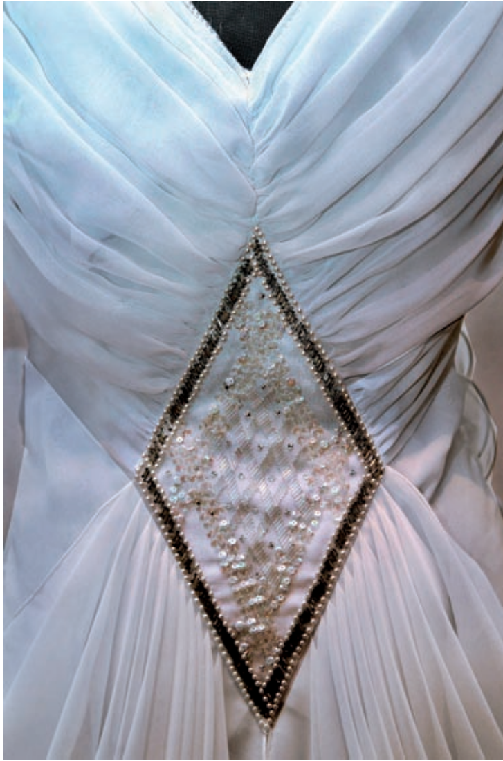
All världens brudar, Malmö museer 2004.