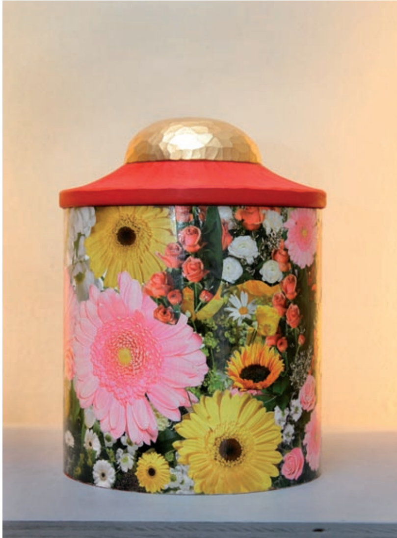
Sakralt, Skånekraft, Lund 2005.