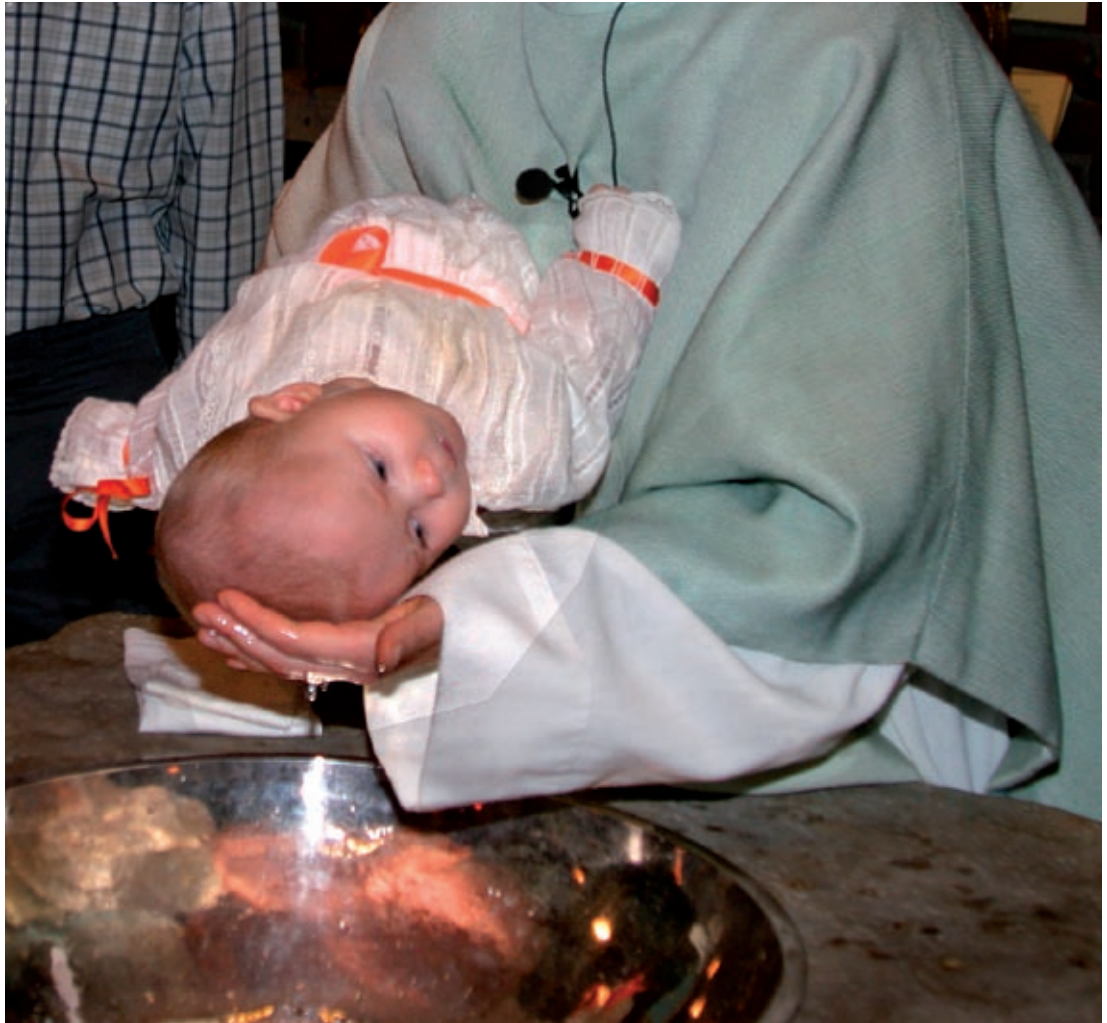
Barndop, Lund 2005.