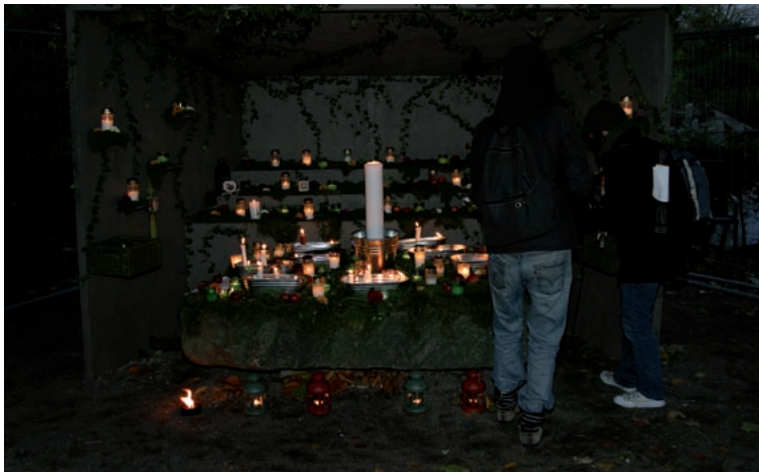
Altare i Slottsparken, Malmö 2006.

Den aktivitet som uppskattades mest av Malmöborna, var ett altare som skapades i ett hörn av den stora Slottsparken. Hit till ”De dödas altare” som öppnade i skymningen klockan 16 strömmade människor. Man gick förbi på väg hem från jobbet, tog en sväng dit på kvällen innan altaret stängde klockan 20. Man placerade sina ljus och mindes sina döda helt utan konfessionella eller andra krav. En lågmäld och lättillgänglig men också stämningsskapande och vardagsvacker aktivitet.