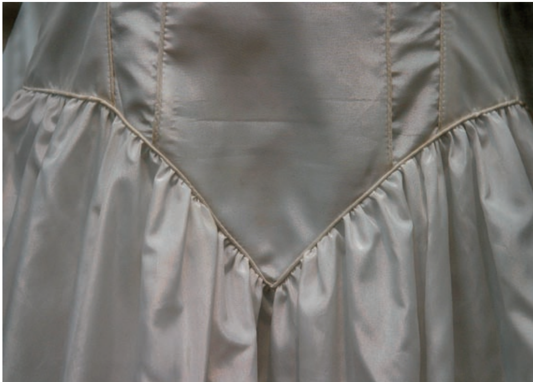
All världens brudar, Malmö museer 2004.