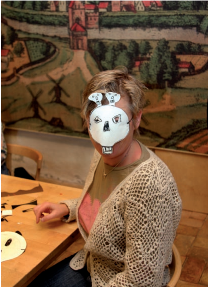
Dödsкульпyslande mamma, Malmö Stadsbibliotek 2006.