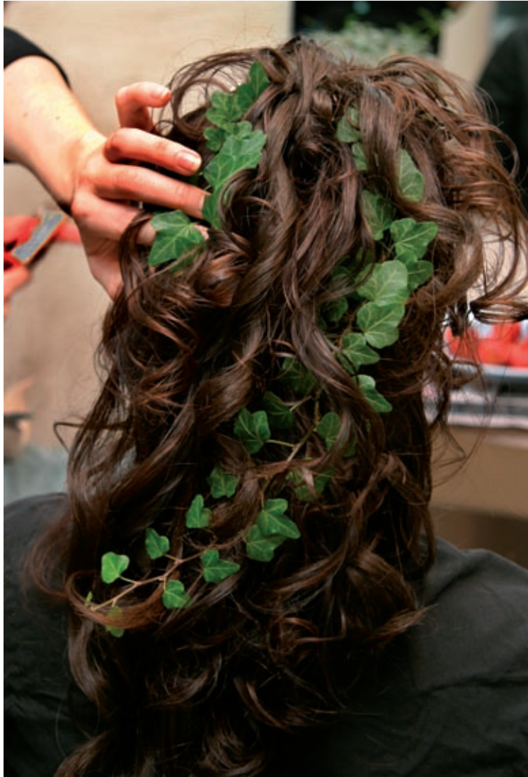
Frisörsalongen Stråh, Lund 2004.