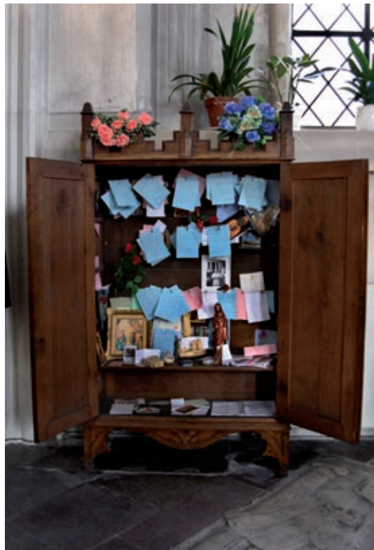
Sankt Petri kyrka, Malmö 2006.

I S:t Petri kyrka kunde man lämna små lappar med hälsningar och tankar till döda nära och kära.