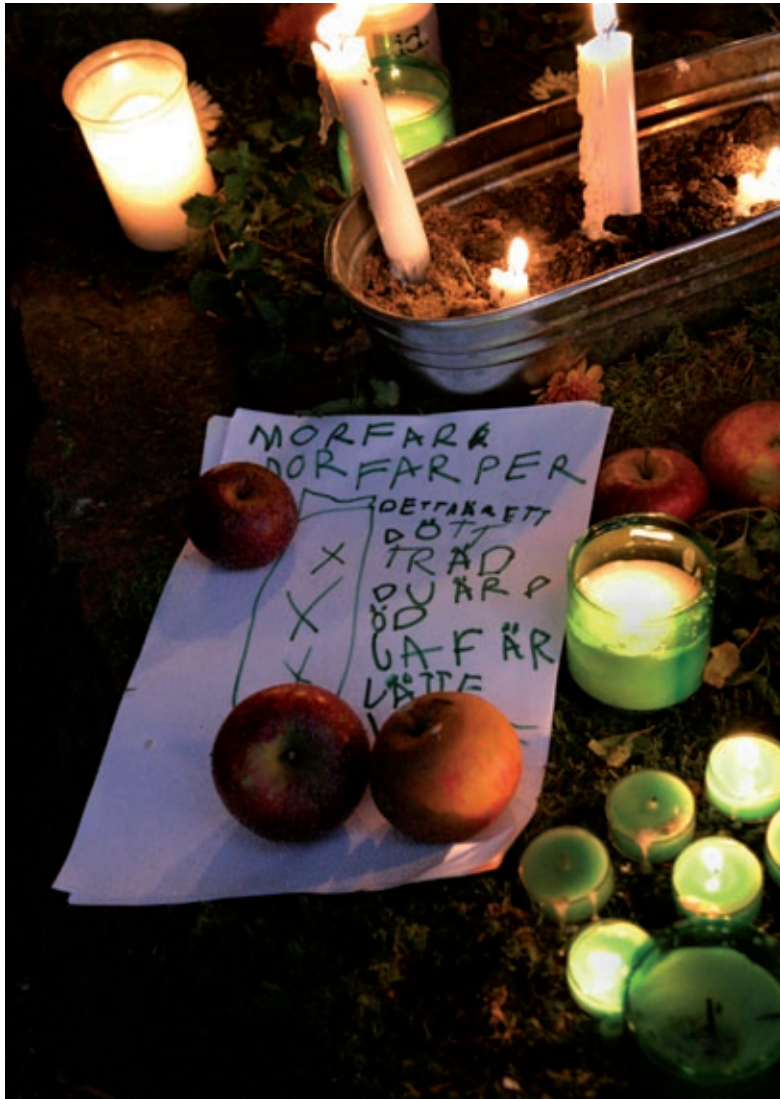
Altare i Slottsparken, Malmö 2006.