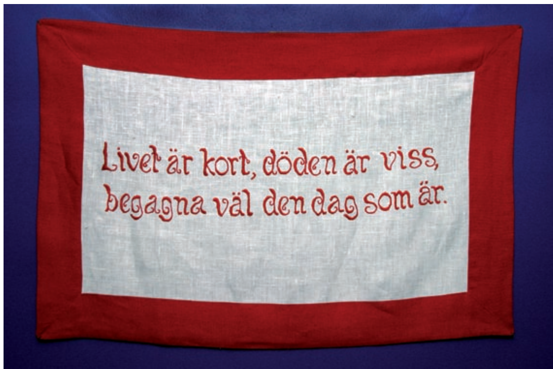
Makt över människan, Malmö museer 2006.