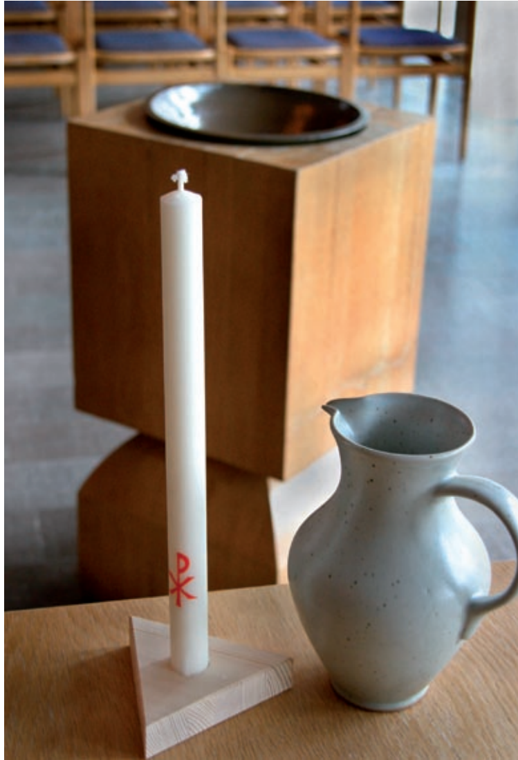
Petersgårdens kyrka, Lund 2005.