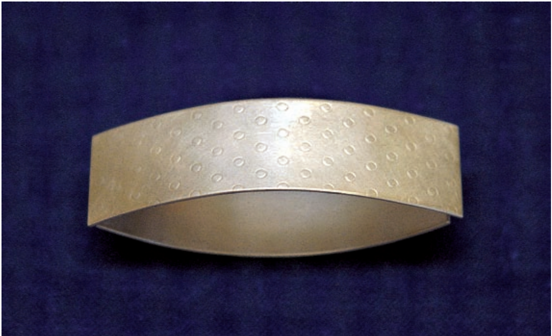
Chrisis silver och smycken, Lund 2004.