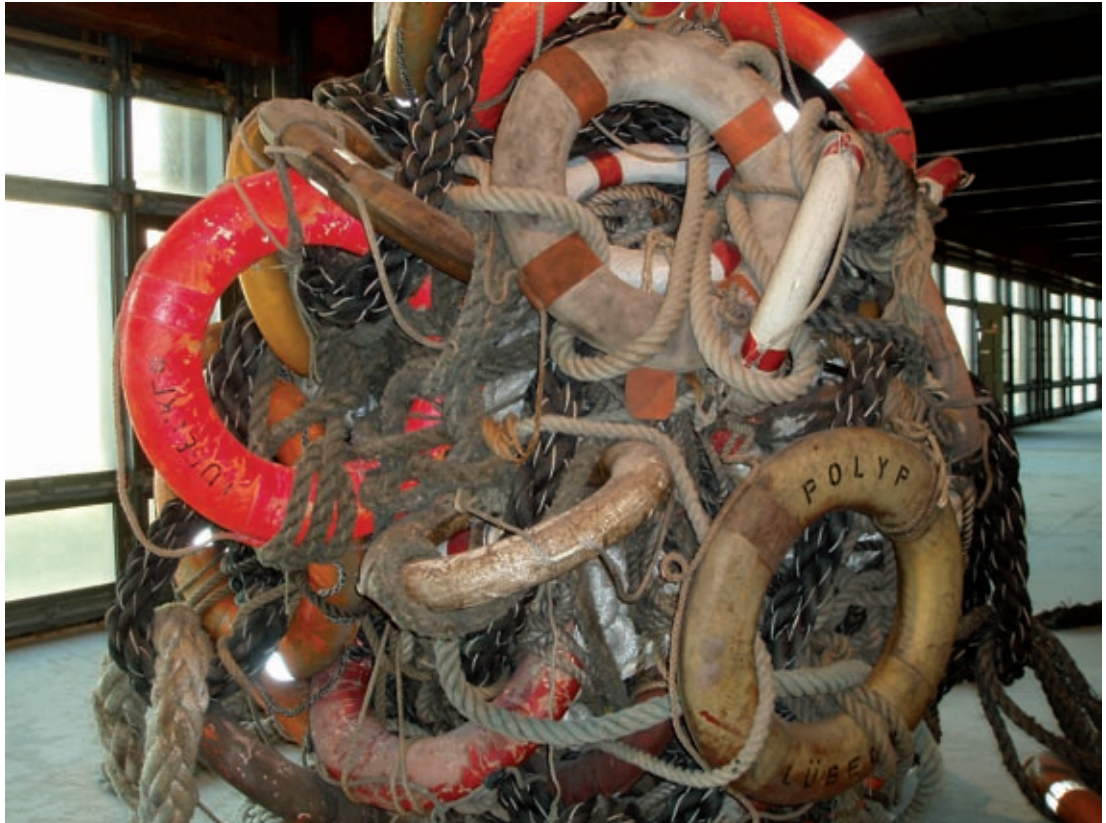
Seelenfänger (detalj). Fraktale IV: Tod, Berlin 2005.