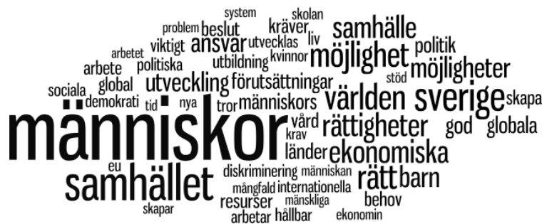
Figur 1: Miljöpartiets program som ”rensat” ordmoln (gjort av de 70 vanligaste orden).

Detta förfarande kan möjligen anklagas för att vara alltför subjektivt, men konsekvent genomfört ger det en tydligare bild av det politiska innehållet i programmen.