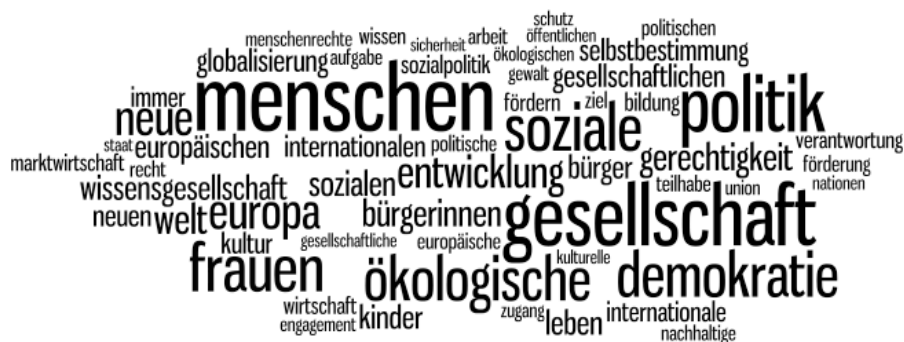
Figur 2: Bündnis 90/Die Grünen's partiprogram som ”rensat” ordmoln (gjort av de 70 vanligaste orden).