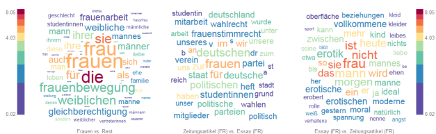
Abb. 2: Wortwolken für die typischen Wörter des Themenbereichs Frauen im Vergleich mit dem restlichen Korpus (links) und in den Textsorten Zeitungsartikel vs. Essay im Themenbereich Frauen (mitte und rechts).

Abbildung 2 zeigt den Beitrag einzelner Wörter zu der Distanz zwischen Teilkorpora in Form von Wortwolken. Groß dargestellte Wörter sind hierbei besonders typisch für ein Teilkorpus, die Farbe korrespondiert mit der relativen Häufigkeit eines Wortes im Teilkorpus (blau für selten, purpur für häufig). Die Wortwolke links vergleicht Frauen mit dem restlichen Korpus. Sie wird sowohl auf begrifflicher Ebene ( Frau/Mann ) als auch auf grammatischer Ebene ( die, ihre, sie, ... ) vom allgemeinen Diskursgegenstand Frauen dominiert. Die Wortwolke in der Mitte zeigt die typischen Wörter von Zeitungsartikeln im Vergleich zu Essays innerhalb des Themenbereichs Frauen , die Wortwolke rechts typische Wörter im umgekehrten Vergleich. Hier wird deutlich, dass Zeitungsartikel sich im wesentlichen um die politisch/öffentliche Stellung der Frau drehen ( Wahlrecht, Frauenstimmrecht, politische ) und Essays um die private Welt der Frau ( Beziehung, Moral, Erotik ). Ein sehr deutlicher Unterschied zeigt sich auch im Numerus von Frau : Plural in Zeitungsartikeln und Singular in Essays .