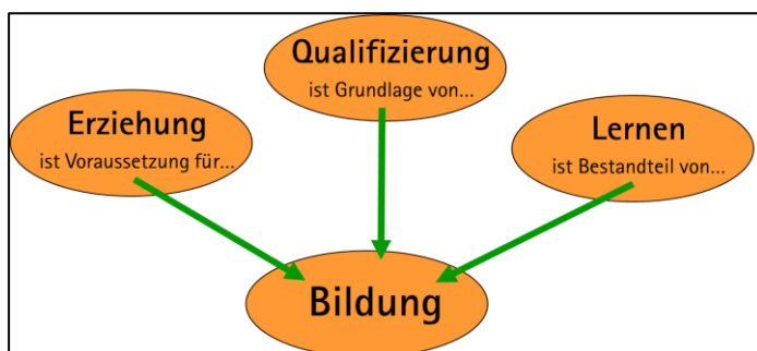
Abb.: Bildung als Ziel von Erziehung und als Ergebnis von Lern- und Qualifizierungsprozessen

Ganz wichtig: Nicht gedacht im Sinne von „Alle machen das Gleiche“, sondern geleitet vom Gedanken der strategischen Kooperation und der Komplementarität: „Jeder leistet in seinem Bereich einen eigenständigen und wichtigen Beitrag zum gemeinsamen Ganzen.“