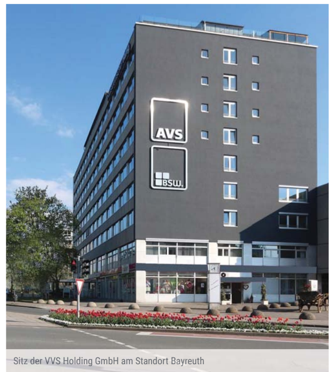
Sitz der VVS Holding GmbH am Standort Bayreuth