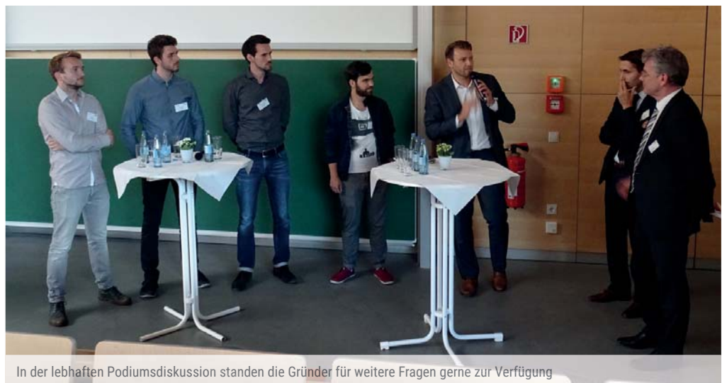
In der lebhaften Podiumsdiskussion standen die Gründer für weitere Fragen gerne zur Verfügung