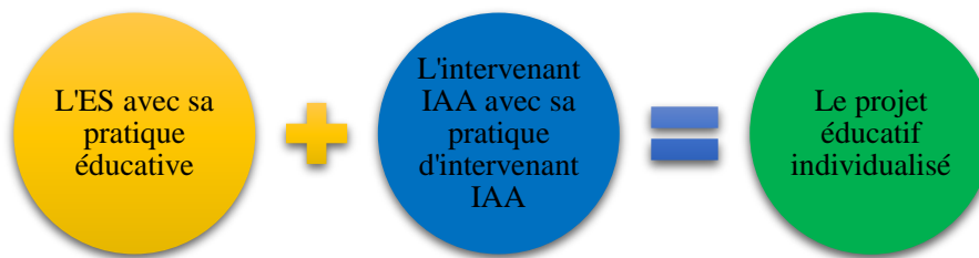
Figure 3: interdisciplinarité entre ES et IAA

Le schéma ci-dessous résume le travail interdisciplinaire entre les ES et les intervenants IAA. Dans la première bulle, figurent l'ES et sa pratique éducative, ce qui est singulier à l'ES, donc ses méthodes, ses connaissances, son savoir-faire, son savoir-être, son savoir agir, ses outils, etc. La deuxième est spécifique à l'intervenant IAA et expose sa pratique d'intervenant IAA qui est composée également de tout ce qui est propre à sa discipline et à sa personne. Si les deux bulles se rejoignent et se mélangent, à l'image par exemple d'une collaboration interdisciplinaire, le résultat sera la naissance d'un outil, d'une pratique concernant le projet éducatif. Ce dernier est un point central dans l'accompagnement de personnes en institution. Cependant, il peut, tout en gardant la ligne directrice de l'institution, revêtir plusieurs couleurs, car il se doit d'être individualisé, en fonction du projet, des besoins et du bénéficiaire lui-même.