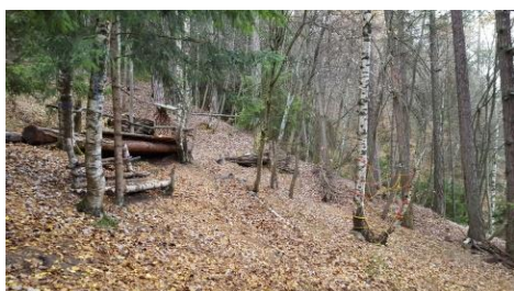
Links Tribüne, rechts Kletterwand