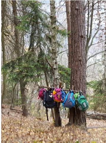
Garderobe für Rucksäcke