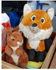
Links Hornli, rechts Strubli