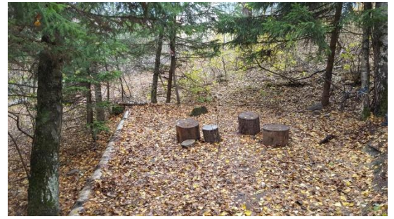
Oberer Platz bei der Lichtung