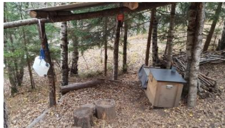
Waldküche und Wasserkannister (links)