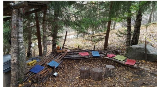
Waldsofa und Sitzkissen