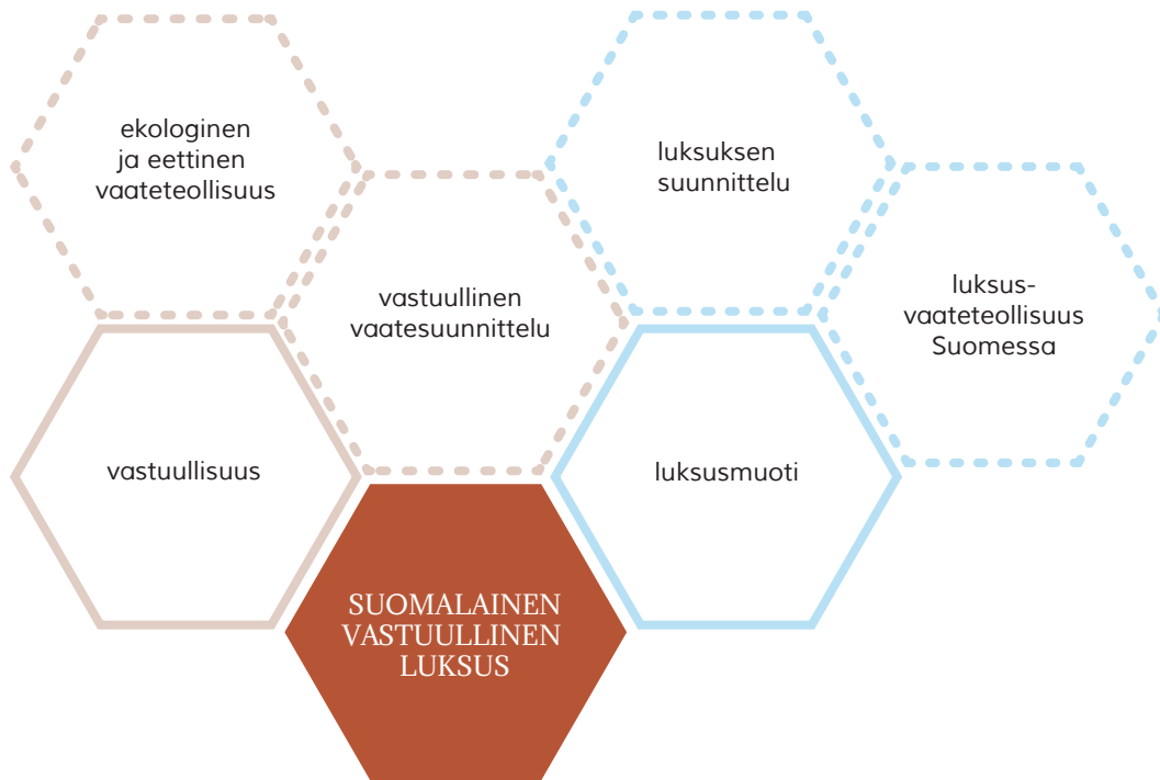
Kuvio 1. Tutkimuksen viitekehys

Pro gradu -tutkimukseni kannalta keskeisiä käsitteitä ovat luksus, vastuullisuus, vaatesuunnittelu, eettisyys ja ekologisuus. Tutkimuksen kysymyksiksi nousevat muun muassa mitä vastuullisuus tarkoittaa tuotteen suunnittelussa, mitä on suomalainen vastuullinen luksus, sekä miten vastuullisuus vaikuttaa luksustuotteen suunnitteluun.