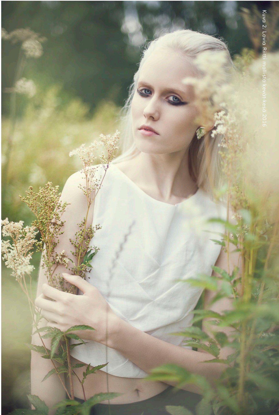
Kuva 2. Lovia Riitti mallisto kevät-kesä 2016

ja se on valikoitunut haastateltavaksi ammatillisen kokemuksen ja brändin tuotantoketjun läpinäkyvyyden takia.