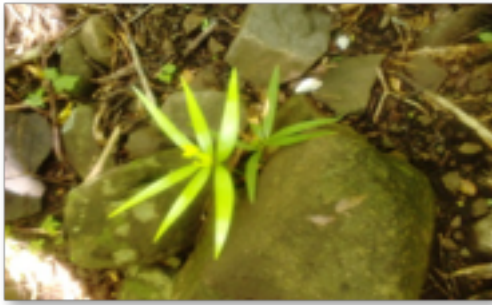
Figura 2. Plántula de Z. inermis en su hábitat natural, Monzomboa, Veracruz, México.

Para tener un panorama más claro sobre el estado de conservación de las poblaciones de Z. inermis , es necesario identificar el potencial adaptativo de la especie, relacionado de manera directa con la diversidad genética, ya que una mayor variabilidad garantiza una respuesta más amplia ante diferentes problemas evolutivos (Lande, 1988). Al respecto, la medida más utilizada para evaluar la variabilidad en las poblaciones es la heterocigosis. Para esta especie, este valor resulta estar por debajo del promedio para la mayoría de las gimnospermas (Hamrick et al. , 1992) y del resto de las cícadas, lo cual la ubica en el rango de las especies del viejo mundo y bastante abajo de la diversidad genética para las cícadas del nuevo mundo (González-Astorga et al. , 2009). Además, las 92 plantas cultivadas en traspatios presentan un valor de heterocigosis mucho menor que lo observado en la población natural, por lo que no resultan representativas de la variabilidad de la especie, con lo cual esta práctica de manejo está generando una pérdida de diversidad. Por todo lo anterior, se podría afirmar que Zamia inermis es la cícada más amenazada de México y probablemente de toda América Latina.