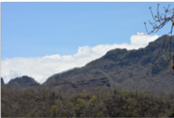
Figura 1. Vista panorámica de la población de Zamia inermis en la Sierra de Manuel Díaz, Monzombo, Veracruz, México

Zamia inermis fue descubierta en un predio particular en 1973 y no fue hasta 1983 cuando se describió formalmente (Vovides et al. , 1983). Para entonces cientos, quizá miles de plantas ya habían sido extraídas con fines de comercialización. Durante años se han realizado extensivos recorridos en la Sierra de Manuel Díaz (Fig. 1), en Monzombo, Veracruz, ubicando únicamente tres subpoblaciones en menos de 2.5 km 2 con un total de 654 individuos, la mayoría de los cuales son adultos no reproductivos.