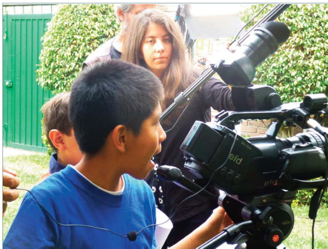
Emociones y aprendizaje. Niños hacen cine en México.