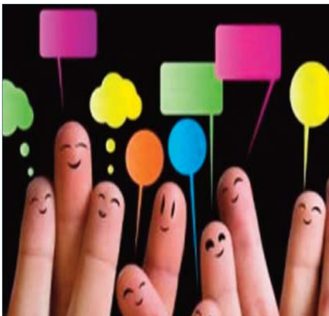
Emociones y comunicación

El comportamiento tiene tres dimensiones básicas: la cognitiva, la emocional y la conductual (las acciones). En estas tres dimensiones entran en juego ambos elementos, conscientes e inconscientes, y su peso e influencia explican el carácter voluntario (consciente)