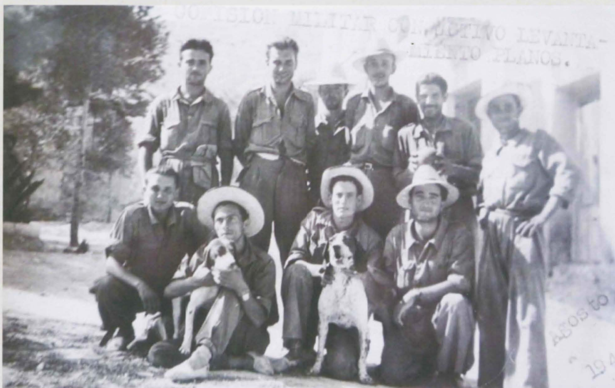
Figura 1. Components de la comissió militar que va realitzar l'alçament topogràfic als camps de Petrer durant l'estiu de 1947.