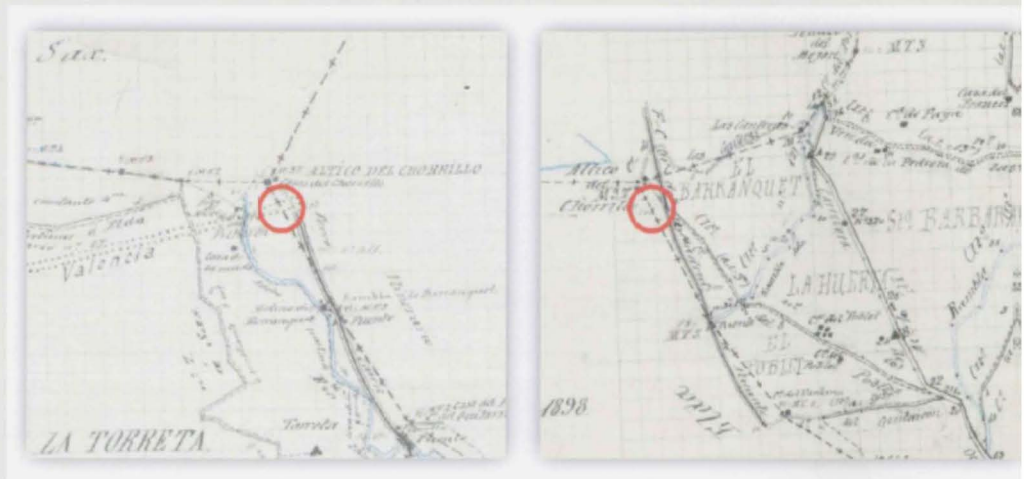
Figura 5. Detall dels esbossos planimètrics d'Elda i Petrer en la zona del Chorrillo. Ací es pot observar la “desaparició” de la Cañada Real d'Andalusia a València en la seua entrada al terme municipal de Petrer.

No obstant això, cal recordar que la finalitat principal d'aquests treballs topogràfics responia més a interessos cadastrals i recaptadors que als estrictament topogràfics. La topografia podia entendre's principalment com el recurs usat per l'Estat per a perseguir el frau i l'ocultació de propietats i terrenys, especialment d'aquells més productius des del punt de vista agropecuari. La topografia era per tant un objectiu desitjat pel Ministeri d'Hisenda, i els seus resultats eren considerats instruments i recursos tècnics per a impedir aquesta situació 14 . És per açò pel que l'esbós planimètric ofereix una informació tan detallada dels habitatges rurals, tant en la seua ubicació com en la seua denominació.