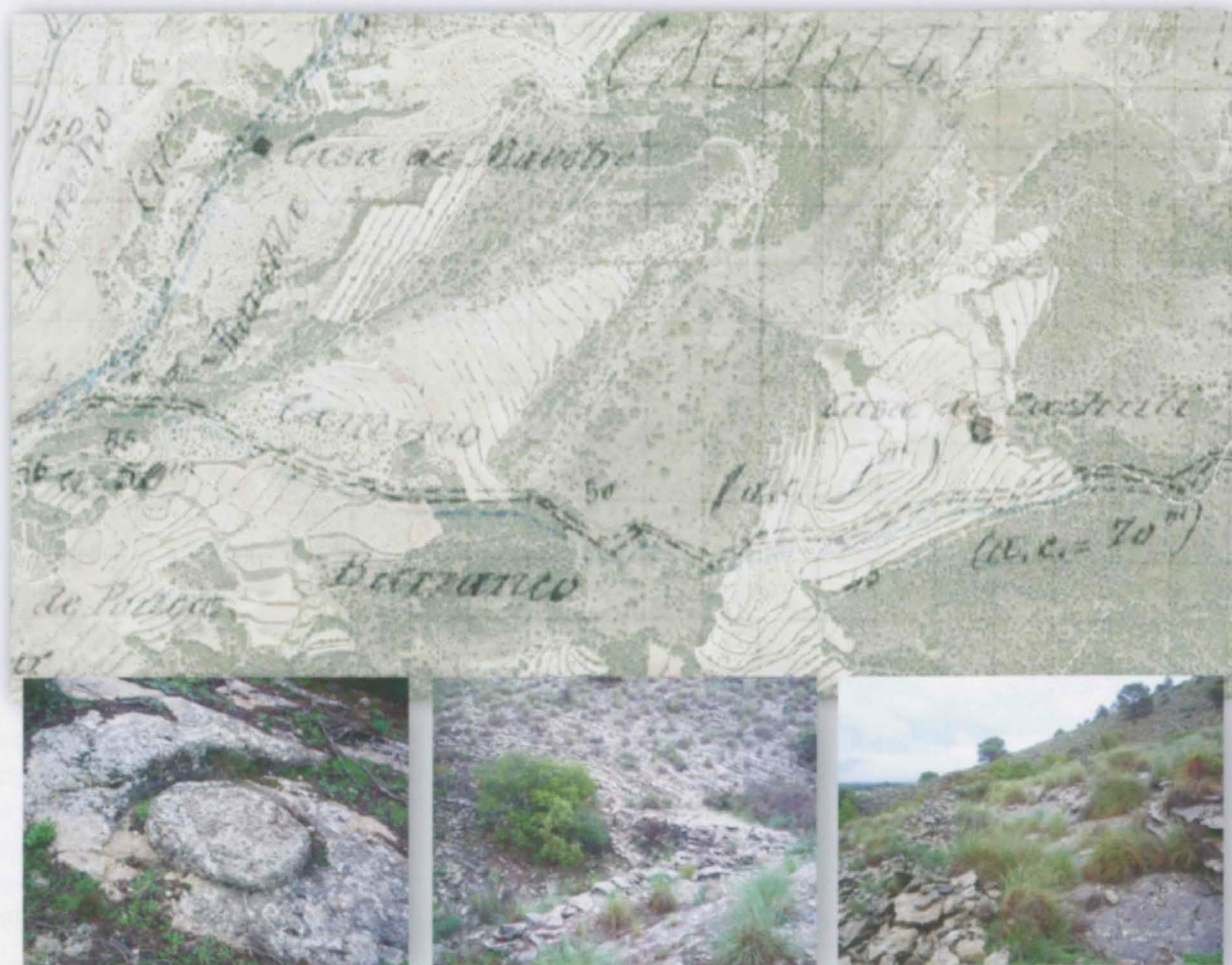
Figura 4. La superposició de l'esbós de 1898 amb l'ortofoto actual revela el traçat de l'antic camí de Petrer a Catí. S'observa com, partint de la rambla de Puça a l'altura de la Llima de Baix, el camí es dirigeix cap a la Cova d'Enrique Amat, per a posteriorment arribar a la finca del Catxuli a través dels Riberos. Posteriorment, el camí coincidiria amb la pista l'actual que condueix al Collado d'Amorós. Es tracta d'un camí abandonat i poc conegut, que mostra peculiaritats molt interessants, com els marges que en alguns trams delimita el camí i algunes marques identificatives que hi apareixen.

s'aprecien alguns vials que són avui eixos importants que parteixen des del centre urbà com el "Camino de Salinetas" (avinguda de Salinetes), el "Camino de Novelda a Petrel" (Avinguda Bassa Perico), el "Camino de Guirná" (Avinguda El Guirnei) o el "Camino de Elda a Petrel". Així mateix, destaquen alguns camins que han respectat el seu traçat tradicional com el "Camino de Agost" o, parcialment, la "Carretera de Ocaña", però també altres camins que avui perduren com a senderes o, senzillament, són ja impracticables.