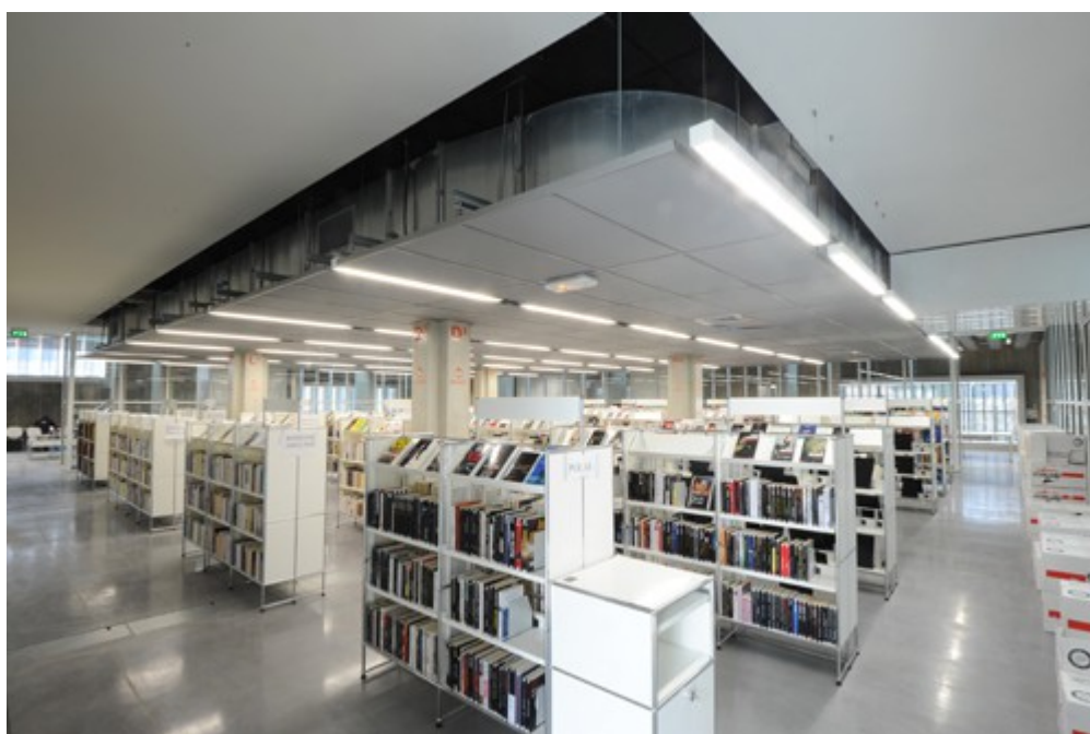
Illustration 1: Vue des étagères de la bibliothèque Grand M (Toulouse)

De même, une présentation des livres de face (en facing, dans le vocabulaire des techniques de vente) permet aux usagers de percevoir plus facilement quel type de livres ils et elles vont trouver dans les étagères. Ainsi, la médiathèque « Grand M » à Toulouse dispose d'étagères d'environ 1,5 mètre dont la partie supérieure est constituée d'un présentoir pour les ouvrages de face. Contrairement à ce qui est souvent l'habitude, ce type de présentation ne doit pas être réservé à la mise en avant de nouveautés mais doit vraiment être conçue comme un outil d'orientation au sein des collections.