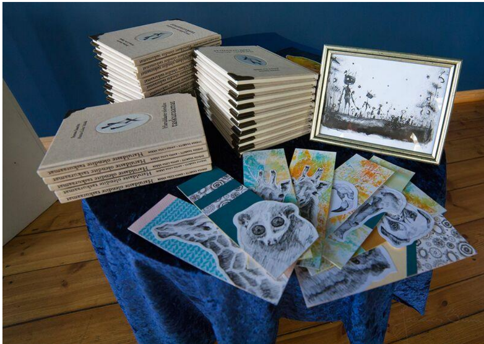
Foto 1. „Haruldaste olendite taskuraamatu” eksemplarid ja hoandja.ee keskkonnas annetajate kingitused.