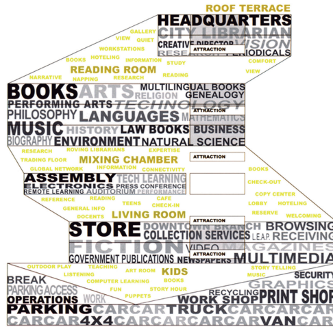
f1_Diagrama conceptual de la Biblioteca de Seattle 2004, OMA

Los ámbitos de estabilidad se configuran como plataformas con condiciones programáticas muy específicas y por lo tanto, cada una de ellas tiene unas características únicas de tamaño, circulaciones, flexibilidad, etc. Los espacios entre plataformas configuran esos ámbitos de inestabilidad. Son espacios creados para provocar la interacción, el intercambio de información, y estimular a la vez el trabajo y el juego o la socialización.