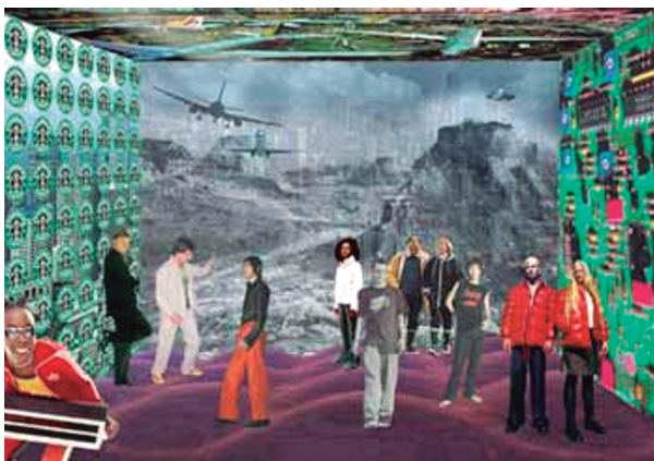
f3_Imagen perteneciente al “concept book” del concurso de la Biblioteca de Seattle 1999, OMA / LMN Architects

Propone una configuración flexible del programa, no a través de la in-especificidad de los espacios, sino mediante la creación de un sistema que genere áreas estratégicas predefinidas cuyo uso puede ser modificado y ampliado. Pretende diseñar un entorno que escenifique la evolución de la ciudad en los últimos años a favor de una cultura emergente y a la vez consiga generar un equilibrio programático entre las funciones tradicionales de una biblioteca y todas las que se han ido añadiendo con la creciente proliferación de nuevas tecnologías y medios audiovisuales. Todo ello le lleva a generar la disposición en plataformas y espacios intermedios, ya descrita con anterioridad. La envolvente facetada surge, según