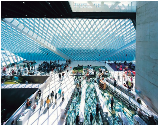
Interior de la Biblioteca de Seattle 2005, OMA