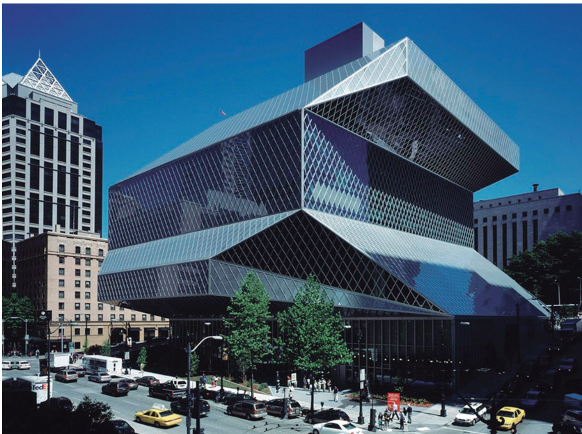
f4_Exterior de la Biblioteca de Seattle 2005, LMN Architects

El equipo americano de Arquitectos LMN no había colaborado antes con el estudio de OMA, pero sí lo había hecho con otras grandes firmas como la de Frank Gehry en el "Experience Music Project", también en Seattle. Resulta habitual en concursos de esa envergadura recurrir a un socio local que posee un conocimiento profundo del entorno institucional, normativo, cultura y social. Presenta un perfil netamente comercial y resolutivo.