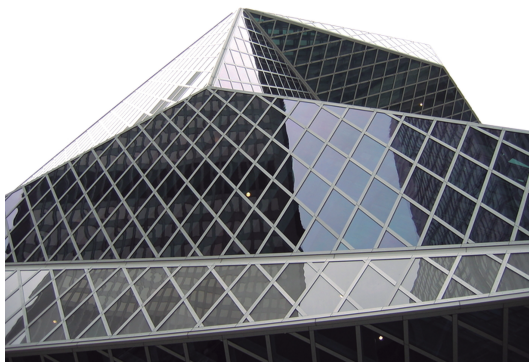
f5_Exterior de la Biblioteca de Seattle 2005, OMA

La firma americana desarrolla el proyecto a través de unas fotografías aéreas que permiten una comprensión completa del edificio dentro de su entorno y también favorecen el entendimiento de la escala, proporciones, materiales, etc. Se muestran los grandiosos interiores, realizando un recorrido visual que permite al visitante acceder a un conocimiento primigenio del lugar sin necesidad de visitarlo físicamente. La narración escrita que se realiza del edificio se basa principalmente en el despliegue de una serie de datos que habitualmente se consideran relevantes en la descripción cuantitativa de un edificio: situación, dimensiones, número de alturas, número de libros, listado de recursos, presupuesto, premios y galardones recibidos, obtención de certificación LEED, etc. Es decir, toda la información facilitada tiene como objetivo la puesta en valor del edificio terminado, incidiendo en sus valores más relevantes de cara a su difusión dentro de un registro principalmente comercial. Por el contrario, desaparece todo vestigio que evoque la imaginación o las posibles interpretaciones que podrían generarse, así como cualquier