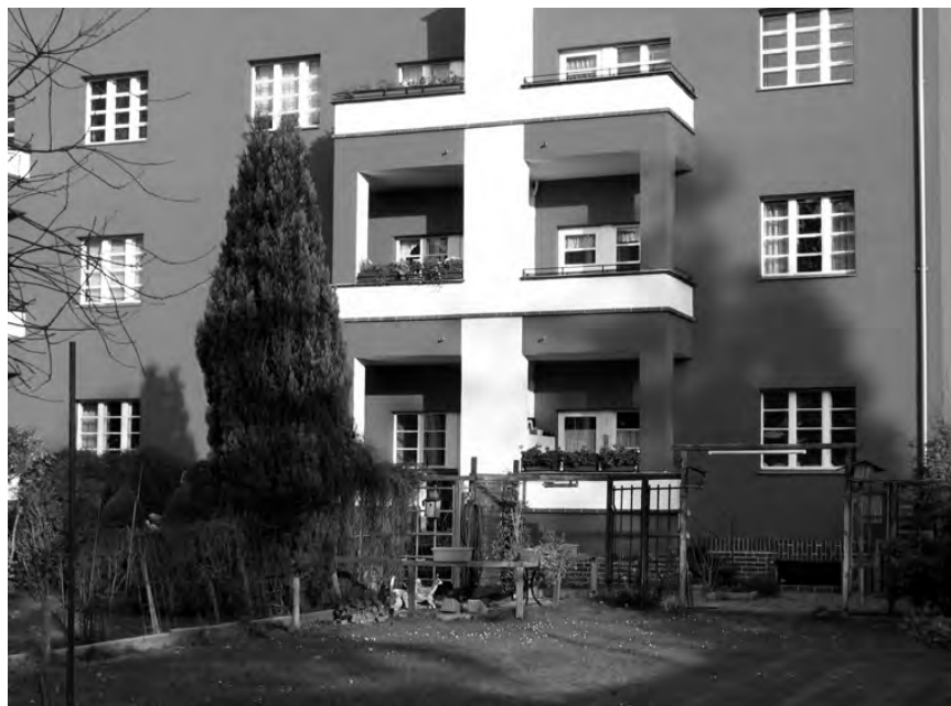
Fig. 4. 'Die Rote Front'. Hufeisensiedlung. Estado actual.

de alcanzar los niveles de confort contemporáneos. Por lo tanto, el único principio al que conviene atenerse en esos casos es que incluso las intervenciones consideradas de mantenimiento, de rutina, sean a todos los efectos “problemas de arquitectura” que, como tales, deberían requerir la movilización de expertos del más alto nivel. El problema, entonces, no afecta tanto al principio como al proyecto: no se trata tanto de “sí” intervenir o no, sino de “cómo” intervenir. Añadir los ascensores al volumen del Klose-Hof no es tarea fácil y se puede admitir incluso de momento que no sea posible lograr un resultado mejor que el producido por el trabajo de 1988. Admitiendo que ese sea el mejor resultado posible, en atención a los imperativos técnicos y económicos, ¿qué posición crítica convendrá adoptar?