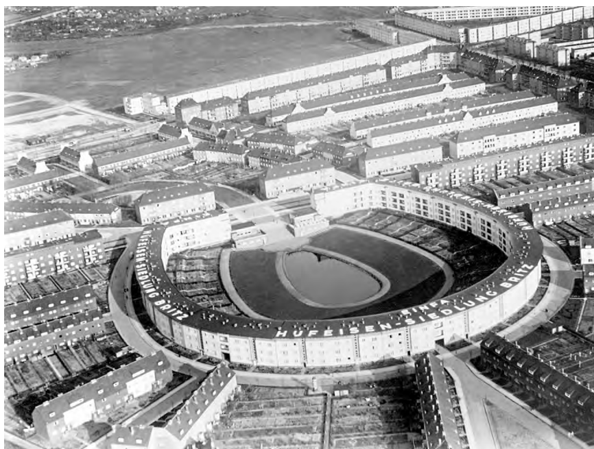
Fig. 1. Bruno Taut, Martin Wagner y Migge Leberecht (paisajismo), Großsiedlung Britz, Berlín, 1925-1933. Vista aérea. Hufeisensiedlung en primer plano.

les “modernos” y, por muchas razones, más próxima a la estética de la vanguardia. Hoy, a casi un siglo de distancia, estas experiencias deben ser observadas, estudiadas y comprendidas al margen de los supuestos ideológicos que a veces han distorsionado su interpretación. Pero sobre todo es necesario analizar los resultados obtenidos no sólo a la luz de los debates de la época, sino en relación con la ciudad contemporánea.