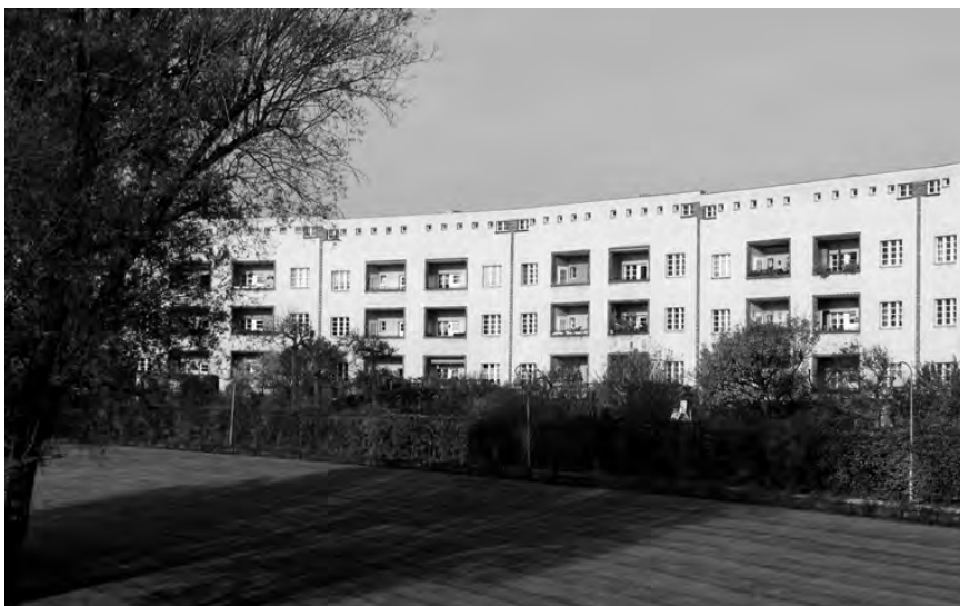
Fig. 3. Parque central. Hufeisensiedlung. Estado actual. (Fotografía Luca Conti).

volviendo al uso original después de los recientes trabajos de mejora y actualización energética (lograda con una capa de aislamiento térmico externo que ha cambiado, obviamente, las proporciones generales de los frentes). Más allá de las implicaciones de carácter tipológico, este tipo de intervención—ciertamente muy difundida—plantea muchas dudas.