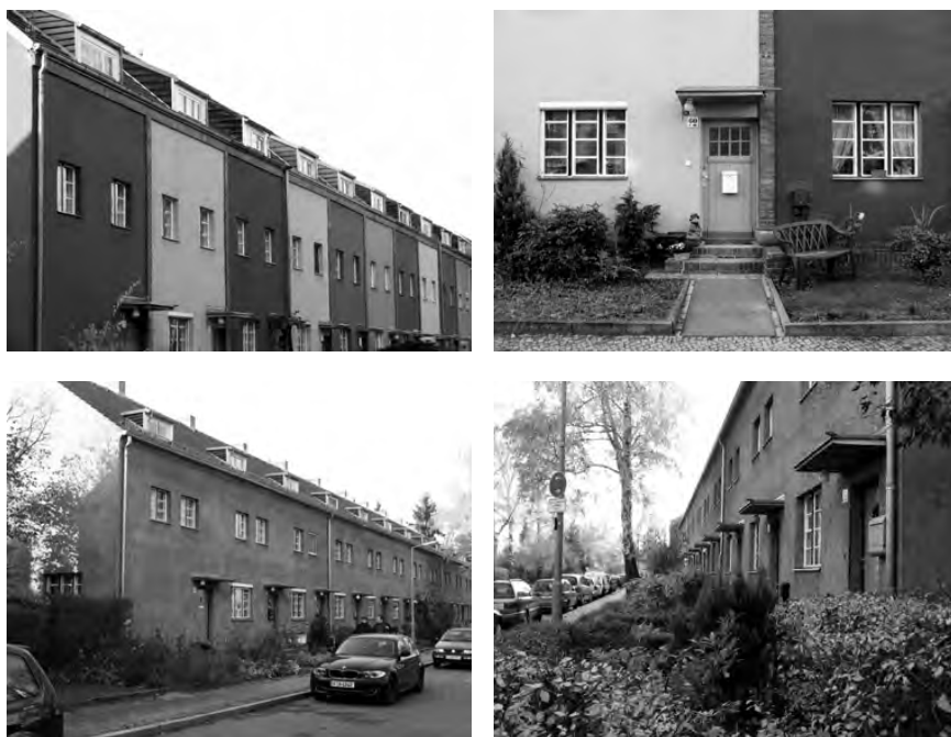
Fig. 5. Großsiedlung Britz. Estado actual. (Fotografía Luca Conti).