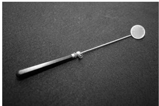
Figura 6. Espejito laríngeo laringoscópico s. XIX.

que ofrecerá Manuel García con la invención del espejo laringoscópico, dando lugar de esta manera al inicio de la laringología como especialidad 6, 22, 23 . (Figura 6).