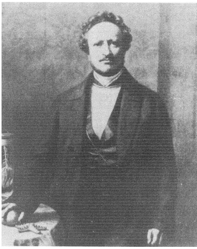
Figura 2. Johannes Müller (1801-1858), Profesor de Fisiología de las Universidades de Bonn y Berlín.