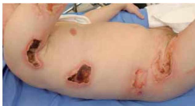
Figura 6. Delimitación de la escara necrótica a los 7 días. Resolución de las zonas quemadas de primer grado.

10000 U/l, ya que únicamente los pacientes que fallecieron sobrepasaron estos niveles. Paralelamente, Kopp et al. , señaló una relación entre una fuerte elevación de los niveles de P-CK y la mortalidad en pacientes con quemaduras eléctricas 12 .