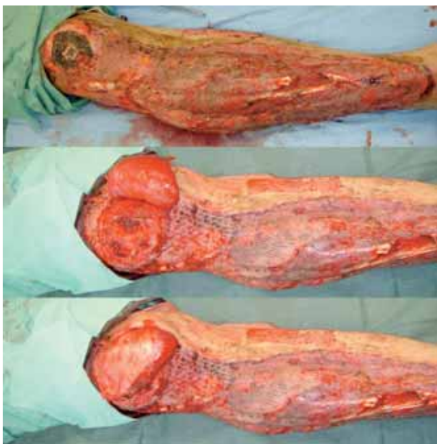
Figura 8. Colgajo de gemelo para la cobertura de la patela parcialmente necrosada (de arriba a abajo: Necrosis, tras desbridamiento y disección del colgajo, tras cobertura con colgajo)