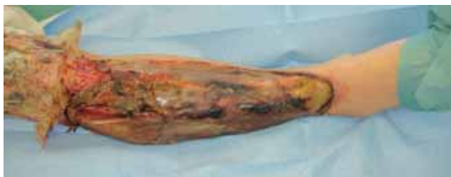
Figura 7. Aspecto del injerto de piel de cadáver sobre el músculo parcialmente necrosado después de una semana.

Estos pacientes requieren ingreso en la UCI de la unidad de quemados 9 . La reposición líquida se realiza siguiendo la