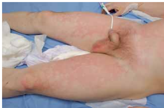
Figura 2. Evolución de las quemaduras a las 4h, con una clara disminución del eritema.