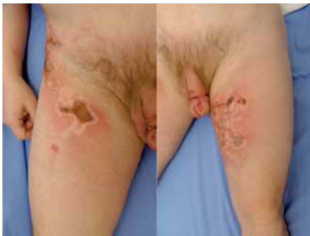
Figura 3. Mismo paciente al cabo de una semana, con las zonas delimitadas de tercer grado.