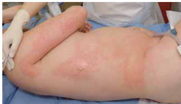
Figura 5. Disminución del eritema a las 4h.

Recientemente Koski et al. publicó una serie de 6 casos de quemadura por aire caliente en saunas, con una rabdomiolisis fatal 9 . La mortalidad en su serie fue del 50%, y concluye que la mortalidad excede a lo que le correspondería por el porcentaje de SCQ. Los niveles de creatin-quinasa plasmática (P-CK) parece que están asociados a la severidad y la extensión de la lesión. El mejor factor pronóstico para la supervivencia es el valor de la P-CK en el segundo día postquemadura 9 . En la serie de Koski, aparentemente el nivel crítico de P-CK al segundo día es de