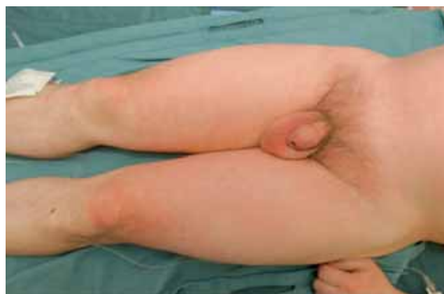
Figura 1. Marcado carácter eritematoso de las quemaduras al ingreso.

La deshidratación en los pacientes bajo la influencia del alcohol amplifica el riesgo de hipotensión debido a la acción diurética del etanol 10 . El riesgo de hipotensión se exagera cuando se combinan la sauna con el consumo de alcohol 11 . El descenso de la presión arterial disminuye la circulación sanguínea en la piel. Esto incrementa el calentamiento de la piel, un efecto más marcado en las partes externas y superiores expuestas al aire caliente. Las zonas quemadas se encuentran en aquellas partes del cuerpo que están directamente expuestas al aire caliente. Si se encuentra a la víctima tumbada sobre su lado izquierdo, las zonas quemadas están típicamente en