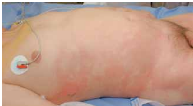
Figura 4. Eritema post quemadura al ingreso.

el lado derecho del cuerpo, dejando el otro lado sin lesiones 9 . Son infrecuentes las quemaduras en la zona de cabeza y cuello, independientemente de la posición. Por el contrario, las amputaciones de dedos son parte habitual del tratamiento.