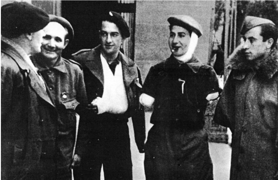
Imagen 1. Varios heridos, uno de ellos requeté del Tercio de Montejurra mutilado de ambos brazos, conversan con un periodista.

Su impacto en la vida de quienes las padecieron aflora inevitablemente en sus testimonios, que en algunos casos nos desvelan experiencias dramáticas, y otras veces recuerdos íntimos o aspectos cotidianos 1 . Pequeños detalles que resultan fundamentales para entender cómo se vivió la guerra desde la Sanidad Militar, tanto desde los frentes de batalla como en los hospitales de retaguardia.