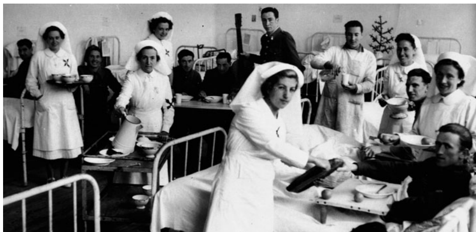
Imagen 4. Enfermeras y heridos en el hospital Alfonso Carlos de Pamplona.

«Había mucho humo que bajaba a ráfagas, producido por la combustión de algunos pinos; escaseaba el agua y la del tonel del botiquín estaba muy caliente; el aire, como enrarecido. En consecuencia: calor intensísimo, fatiga, emociones violentas, falta de agua fresca, baja presión de oxígeno y cansancio se conjugaron para producir un violento, universal y fortísimo “golpe de calor” y de insolación colectiva, que afectó en pocos minutos a la casi totalidad del batallón. Recién llegados al barranco, observé que un soldado se tiraba al suelo, con cara pálida; creíle cansado del peso del fusil ametrallador, pero bien pronto vi cómo comenzaban a caer, como fulminados, un sinnúmero de soldados y de oficiales que, con respiración anhelante, fatigados, disneicos [sofocados], pulso filiforme [débil], hipotensos, con facies amarillentas unos y algo vultuosa otros, nariz afilada, expulsando espuma por la boca, con movimientos convulsivos en extremidades, “shockados”, sin conocimiento, yacían en cualquier parte (...). Dábamos agua a gotas, utilizando los restos de cuantas cantimploras hubimos a mano, colocando los enfermos en los sitios más resguardados del sol, procurando por todos los medios, registrar todo el campo en evitación de que algunos despistados o cubiertos por matas o piedras dejaran de recibir los auxilios debidos» 14 .