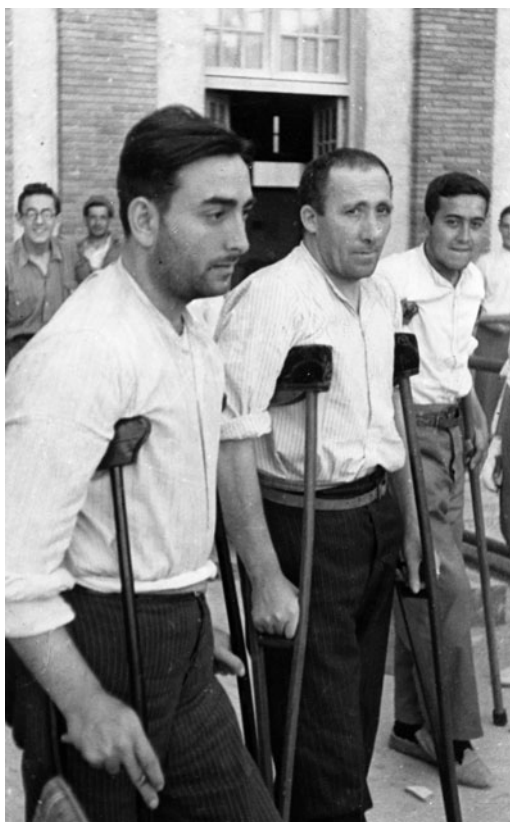
Imagen 3. Tres requetés heridos, de edades diferentes, en el hospital Alfonso Carlos.

No todos los casos fueron tan dramáticos, y algunos heridos tenían verdadera suerte. Una herida sin gravedad ni riesgo vital —lo que se conocía por “un tiro de fiesta mayor”— suponía para los agraciados el traslado a un hospital de retaguardia y olvidar el frente por una temporada. Primero venía la evacuación, a veces realmente penosa y repleta de riesgos; después la primera cura en el puesto de socorro; más tarde, una segunda valoración más sosegada en el hospital de sangre y, según la gravedad, una primera intervención de urgencia por equipo quirúrgico de vanguardia. De allí, en ambulancia en tren hospital a los numerosos hospitales de retaguardia habilitados en hoteles, balnearios, colegios o seminarios.