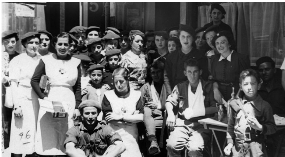
Imagen 6. Enfermeras de Frentes y Hospitales ofrecen tabaco a los heridos en las terrazas de Pamplona.