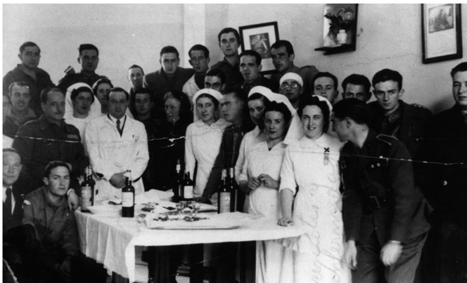
Imagen 5. Médicos, enfermeras y heridos en una fiesta celebrada en el Hospital Alfonso Carlos.

Vistas desde la otra orilla, la del soldado herido o convaleciente, tenemos las reflexiones de Rafael Abella, que en su magnífica obra La vida cotidiana durante la guerra civil supo disecar como pocos el ambiente sociológico de aquellos hospitales: