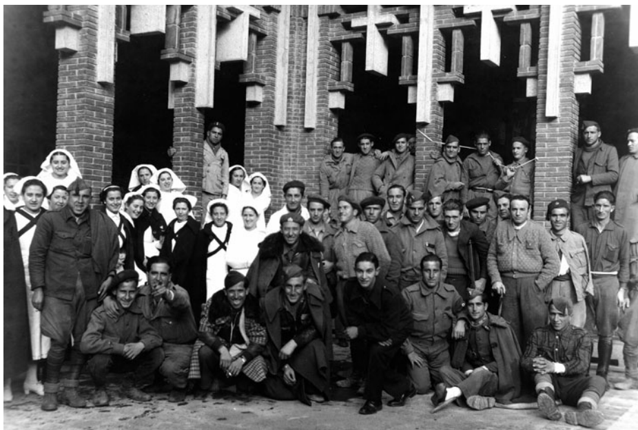
Imagen 2. Heridos y enfermeras en uno de los patios del Hospital Alfonso Carlos.