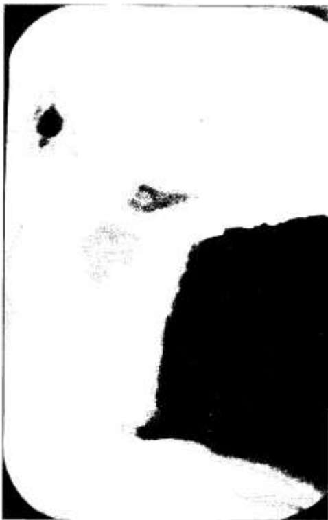
Figura 1 B. Radiografía postoperatoria que muestra la artrodesis occipito-cervical con 2 placas de Roy-Camille y tornillos a nivel occipital y en la tercera y cuarta vértebra cervical que se utilizó para estabilizar el área.