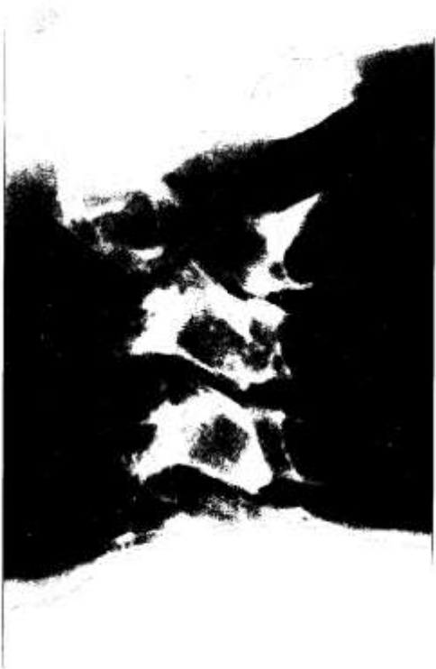
Figura 1 A. Radiografía cervical lateral preoperatoria de una metástasis en el cuerpo e istmo de la segunda vértebra cervical de una mujer de 39 años de edad, 4 años después del diagnóstico de un adenocarcinoma de mama.