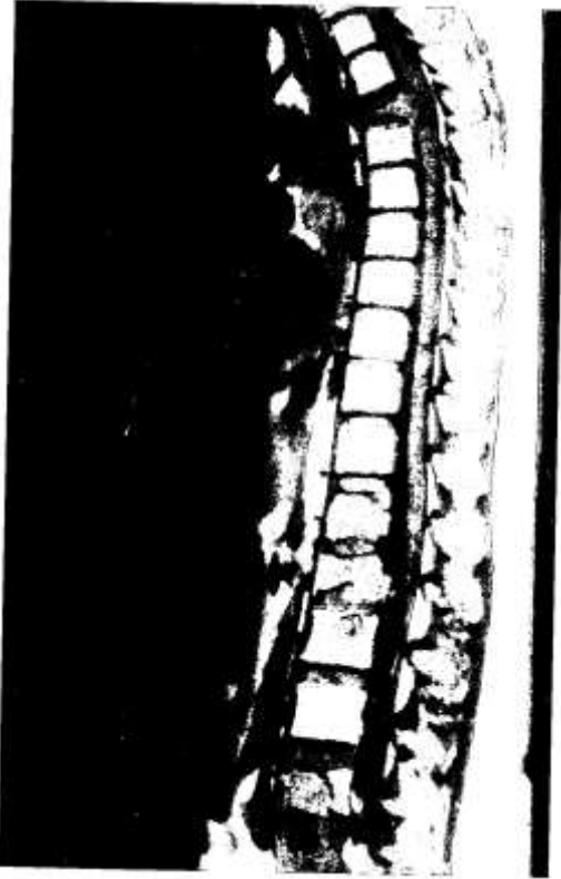
Figura 2 A. Resonancia magnética preoperatoria de columna de una mujer de 38 años de edad, con metástasis a nivel de la cuarta y décimosegunda vértebra dorsal y primera, cuarta y quinta vértebras lumbares por un carcinoma de tiroides.