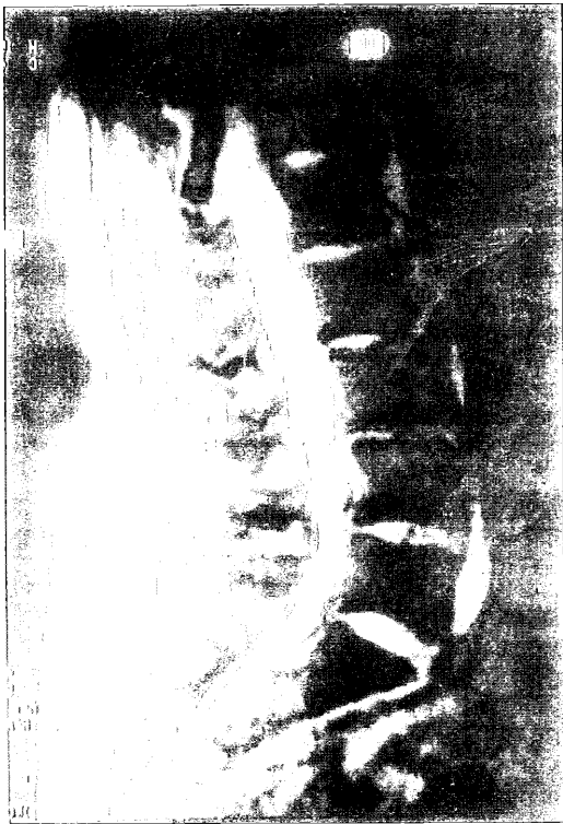
Figura 2. Corte sagital de RM, que evidencia lesiones artrósicas del raquis lumbar, con signos de inestabilidad mecánica crónica, patología discal anterior a la altura de los segmentos L1-L2 y L2-L3 y estenosis degenerativa de canal a la altura L4-L5.