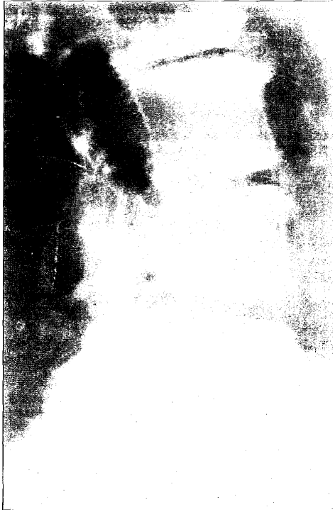
Figura 1. Radiografía lumbar lateral que muestra lesiones artrósicas evolucionadas con discopatías a múltiples niveles.