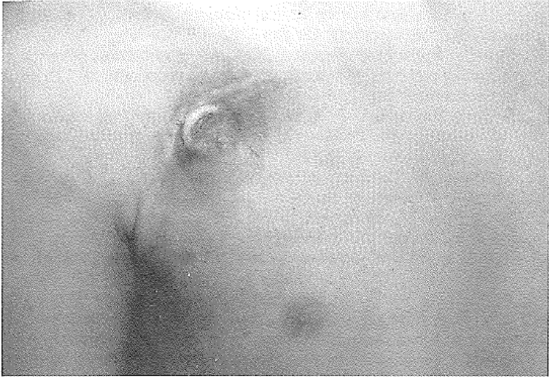
Figura 1. Decúbito de reservorio tras infección local de la zona.