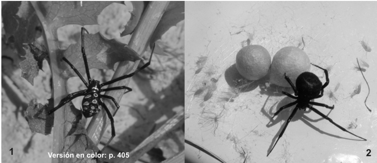
1 Versión en color: p. 405