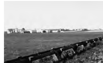
Sector III, Matoso.