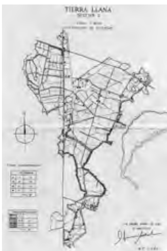
Sector II, plano situación.