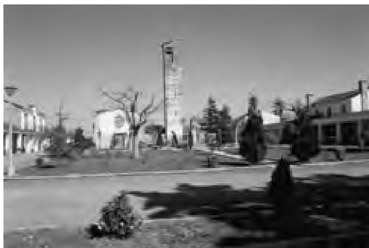
Arneiro, Centro Cívico.

Como antecedente, la experiencia italiana que recurre mayoritariamente a la colonización dispersa, concentrando en los pueblos los servicios y las viviendas de sus trabajadores: el precedente del Agro Pontino en la década de los 30 y la Bonifica Integrale 6 .