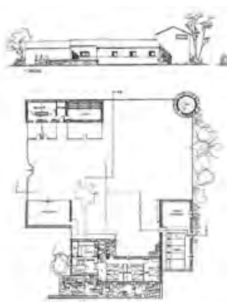
Sector III, planta vivienda tipo.

La vivienda de planta baja y forma rectangular vincula al viario su lado mayor y ocupa la posición central entre el cobertizo y el volumen establo-henil dispuesto en dos plantas que se adosa ortogonalmente al cuerpo residencial.