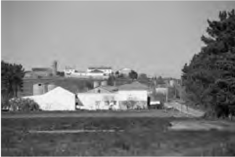
Sector II, Veiga do Pumar.

El de Arneiro, de ejecución posterior, es el centro cívico de mayor tamaño y con servicios más especializados. Plaza rectangular, abierta por un lado, presidida por el centro parroquial (iglesia y locales de Acción Católica) y lateralmente flanqueada por sendos volúmenes porticados: uno institucional y otro comercial. Ayuntamiento que funcionará como oficina de colonización e hilera de cuatro comercios con sus respectivas viviendas.