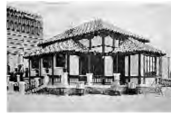
Pabellón escuela de construcción popular, hacia 1929. Arquitecto Antonio Flórez.

Serán las aulas las que, al ser los espacios donde se desarrolla la enseñanza durante la mayor parte del horario escolar, estén normalizadas hasta el más mínimo detalle, desde sus dimensiones en planta y altura, que determinarán la cubicación de aire óptima, hasta el tamaño y disposición de los huecos, los materiales utilizados para suelos y paredes, la disposición redondeada de las esquinas, etc. y, por supuesto, las condiciones de ventilación y calefacción de las mismas.