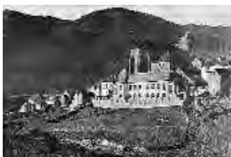
Oficina Técnica de Construcciones Escolares. Dos escuelas unitarias de niños y niñas, cantina escolar y vivienda para los maestros en Ansó (Huesca).