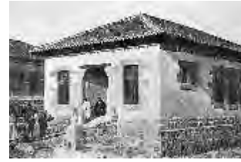
Oficina Técnica de Construcciones Escolares. Escuela unitaria para niños en Tejares (Salamanca).

La primera propuesta de tipos escolares salida de la Oficina Técnica en 1924 9 consistía en una colección de siete modelos de edificios que correspondían a cinco tipos de clima distintos: para clima frío y seco, para clima templado y lluvioso, para clima caliente y seco, para clima muy frío y nieves frecuentes y, el último, para clima frío y lluvioso. La mayor parte corresponden a programas de escuelas unitarias y mixtas, sólo uno a una escuela graduada. Tanto los materiales como los sistemas constructivos y compositivos utilizados derivarán del examen y análisis de las arquitecturas populares.