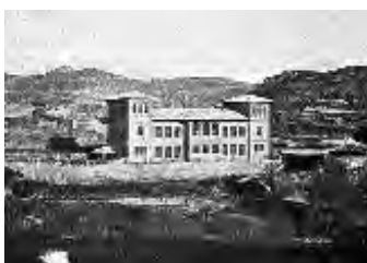
Oficina Técnica de Construcciones Escolares. Escuela en Uncastillo (Zaragoza).

maestro rural se acrecentará no poco si se le coloca en un edificio de tales condiciones. No hay que extenderse en las ventajas educativas de él sobre los alumnos; en cómo, también para éstos, la escuela tendrá más o menos prestigio, según sea el edificio en que esté instalada; de cómo, si esa escuela es amplia, limpia, soleada, ese niño, el día de mañana, querrá vivir en condiciones distintas a las que vivieron sus padres”. De ahí el papel que se le quiso dar a la educación como motor de transformación social del país en estos años.