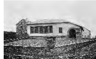
Oficina Técnica de Construcciones Escolares. Escuela unitaria para asistencia mixta en Escuer (Huesca).