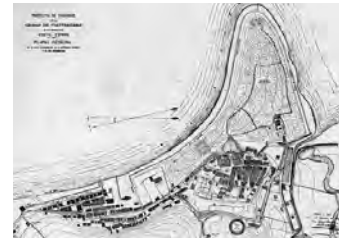
Proyecto de Ensanche del Puntal España. José Ángel Fernández de Casadevante, 1914.