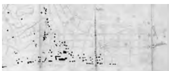
Estado edificación del Plan Martinet en Hendaya, 1928.

los contenidos de una arquitectura vascofrancesa rural equiparable a la representada por el barrio de pescadores de Fuenterrabía.