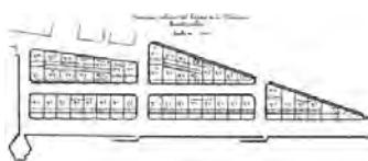
Proyecto Ensanche de la Marina. Juan José Aguinaga, 1899.