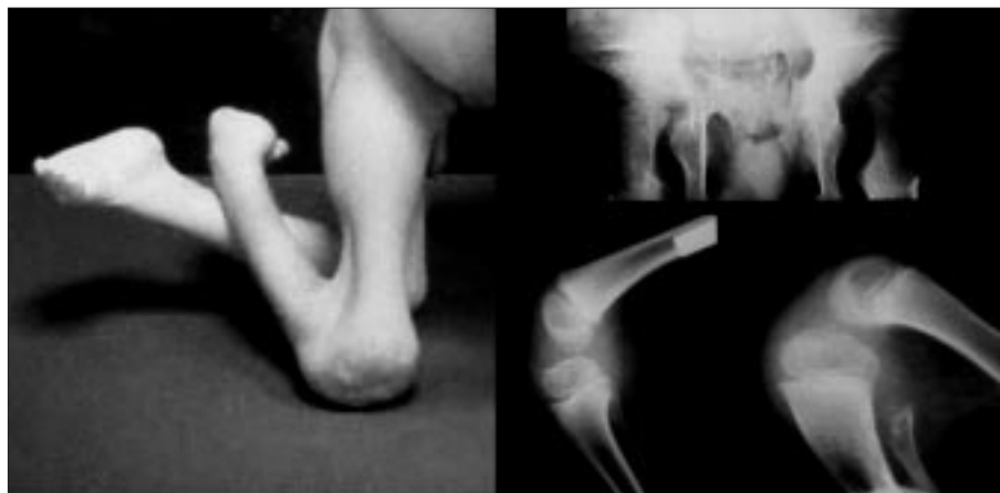
Figura 3. Obsérvese el importante flexo de rodillas con la presencia de membrana poplíteea. Luxación teratológica de caderas. Pies zambos rígidos bajo los glúteos.