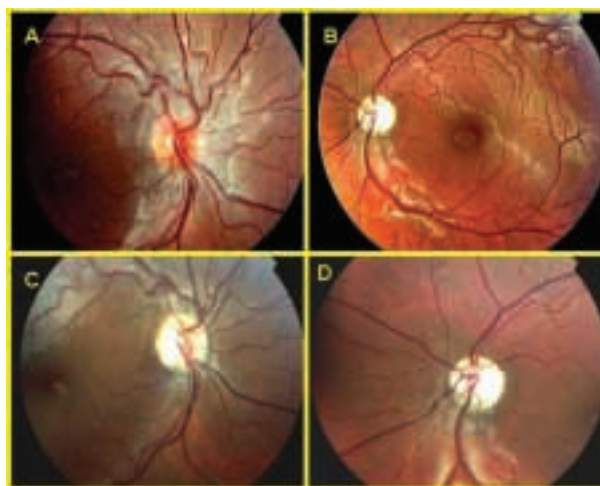
Fig. 1: Imagen fundoscópica de ambos ojos. 1A y 1B: Corresponden a la primera consulta de la paciente en nuestro departamento. 1C y 1D: Imagen correspondiente con la tercera recaída. Se observa la evolución a atrofia óptica del OD.

Se completó el estudio con hemograma, VSG, coagulación, bioquímica básica, serologías víricas séricas (citomegalovirus, herpes, virus de inmunodeficiencia humana, sarampión, parotiditis, Epstein Barr, Herpes 6), pruebas treponémicas (FTA-Abs), no treponémicas (VDRL), serologías de Borrelia y Bartonella , niveles de plomo, vitamina B12 que fueron negativas. Se realizó un análisis genético del DNA mitocondrial no encontrándose mutaciones propias de la enfermedad de Leber. La punción