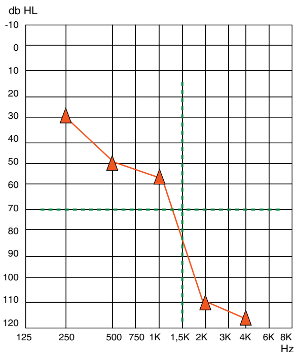
Figura 2 Ejemplo de audiograma para la indicación de una estrategia de estimulación electroacústica o híbrida con preservación de audición tras la colocación de un implante coclear.

*El material empleado en la realización de la audiometría verbal puede ser de una gran variedad. Se recomienda utilizar un protocolo básico de valoración que al menos incluyese las siguientes listas: vocales, palabras cotidianas, bisílabas y frases 11 . Así mismo, resulta de gran interés conocer en qué medida los resultados alcanzados en estas pruebas mejoran con el apoyo de la lectura labial y varían en condiciones de ruido ambiental.