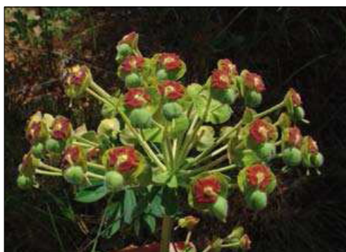
FIGURA 1. Euphorbia characias .

Victor López a Silvia Akerreta b Ignacio Melgar a Rita Yolanda Cavero b M a Isabel Calvo a