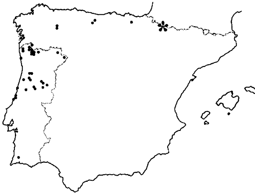
Figura 2. Distribución de Dicranum crassifolium Sérgio, Ochyra & Séneca en la Península Ibérica y Baleares. Mapa basado en SÉRGIO et al. (1995).

Dicranum crassifolium Sérgio, Ochyra & Séneca - Especie descrita recientemente (SÉRGIO et al. 1995), de aspecto muy parecido a D. scoparium Hedw., por lo que posiblemente haya pasado desapercibida y sea mucho más abundante de lo que se considera en la actualidad. Nuestra cita es la primera para el Pirineo y para Navarra y aumenta el área de distribución del taxon hacia el este de la Península Ibérica. En la figura 2 se puede observar el área de distribución en la Península Ibérica y Baleares de Dicranum crassifolium .