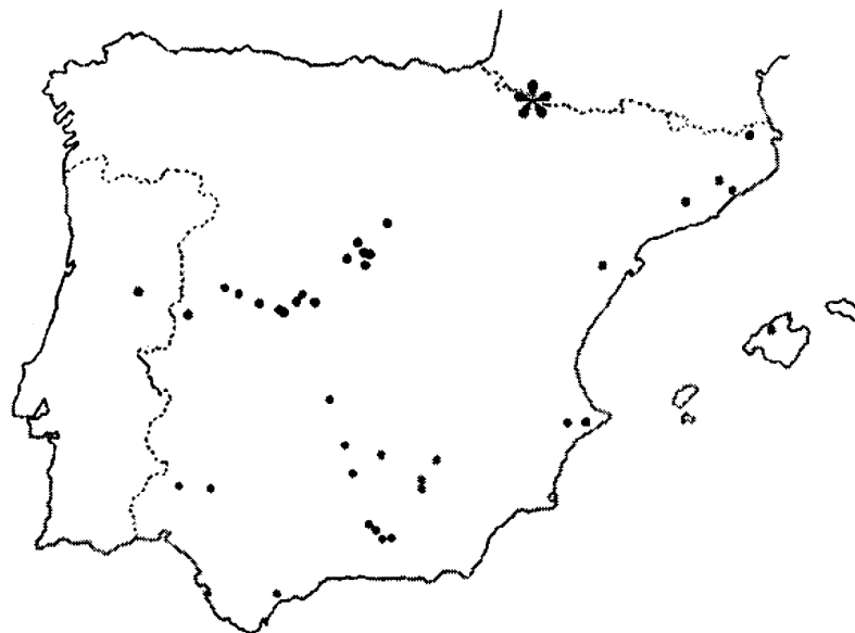
Figura 3. Distribución de Orthotrichum acuminatum H. Philib. en la Península Ibérica y Baleares. Mapa basado en LARA & MAZIMPAKA (1992), CASAS (1994) y CASAS et al. (2001).

Distribution of Orthotrichum acuminatum H. Philib. in the Iberian Peninsula and Balearic Islands. Based on LARA & MAZIMPAKA (1992), CASAS (1994) and CASAS et al. (2001).