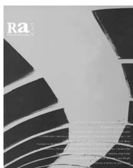
Ra 3 1999