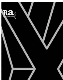
Ra 8 2006