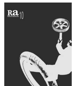
Ra 10 2008