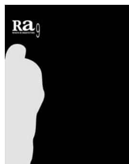
Ra 9 2007