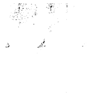
Ra 5 2003