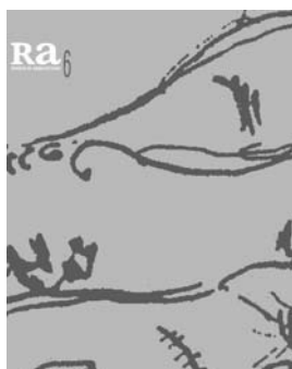
Ra 6 2004