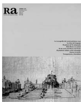
Ra 2 1998