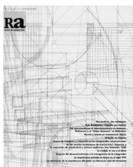
Ra 1 1997