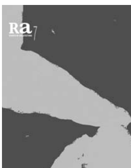
Ra 7 2005