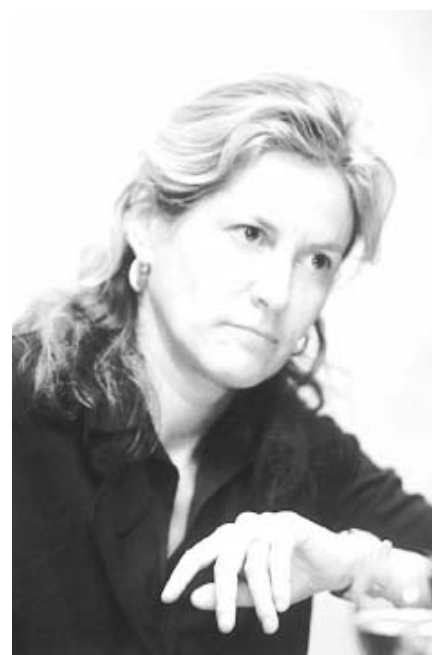
Fig. 1. Romy Golan. Lección inaugural.

A continuación, y sirviéndose para ello no sólo de imágenes arquitectónicas sino también de la iconografía pictórica, comenzó un recorrido por las diferentes actitudes regionalistas adoptadas