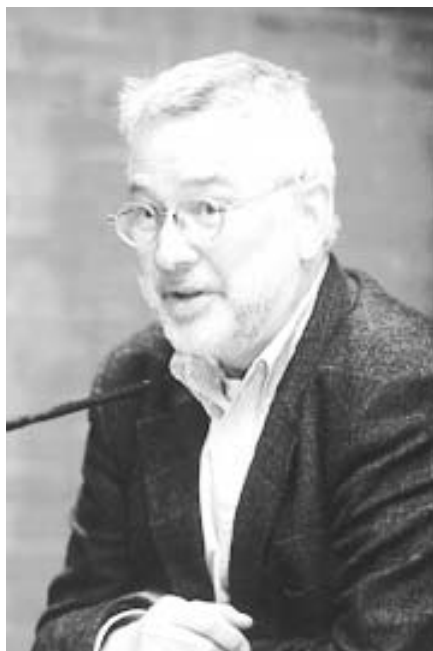
Fig. 9. Stanislaus von Moos clausuró el congreso.

chas migratorias sobre las ciudades y se reveló que la política de Regiones Devastadas no radicaba en reconstruir las edificaciones destrozadas por la guerra sino en la reconstrucción de la riqueza.