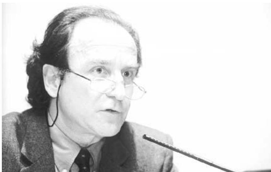
Fig. 2. Josep M. Rovira.

en el período de entreguerras en tres de los principales centros de cultura arquitectónica europea del momento: Francia, Italia y Alemania. En el primer caso prácticamente sólo se aplicaría la opción del regionalismo per se . Aquí no se trataba de una cuestión de desconocimiento —incluso en las zonas más remotas, como la Bretaña, todo el mundo tenía acceso a la cultura de las revistas, especialmente los arquitectos— sino de un verdadero afán por enmascarar la posible autoría de los proyectos y de dotarles de un carácter fuertemente atemporal. De hecho, en la Francia de los años 30, lo regional adquirió mayor magnitud que en los casos italiano o alemán, por razones claramente ideológicas que, según Golan, entraban en relación directa con el sentimiento de nostalgia hacia el pasado que distingue al pueblo francés. En ese sentido, los franceses vieron en el regionalismo una forma de 'domesticación' de lo moderno y lo enfocaron desde un punto de vista 'pacifista', con un sentido distinto al que adquirió en los otros dos países.