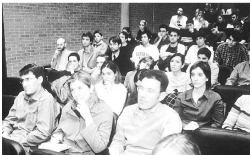
Fig. 8. Aula Magna. E.T.S.A.U.N.

dad histórica para conseguir integrarla en el nuevo universo económico. Finalmente, y a pesar de sus cualidades estratégicas y espaciales, el proyecto no llegó a construirse y, bajo los dictados de la urgencia y la especulación, resultó rápidamente marginado al igual que el resto de su obra.