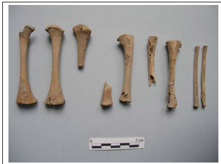
Figura 11.- Huesos de las extremidades inferiores