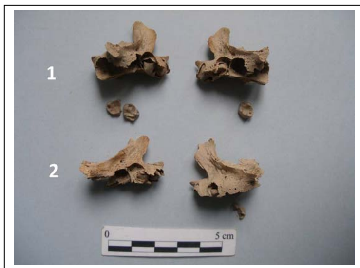
Figura 6.- Maxilas de ambos individuos

Hemimandíbula izquierda casi completa (Figura 7).