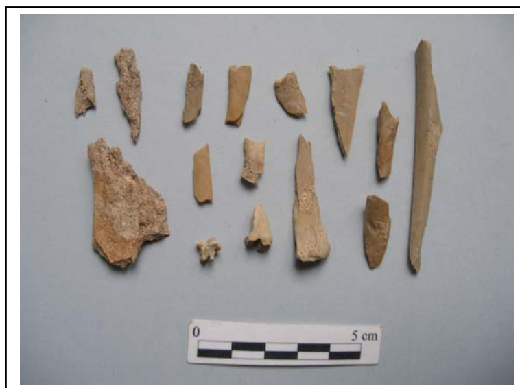
Figura 3.- Restos de fauna identificados junto a los restos humanos.

Procedimos a la elaboración del inventario de los huesos y fragmentos conservados, respetando las referencias identificativas de cada conjunto.