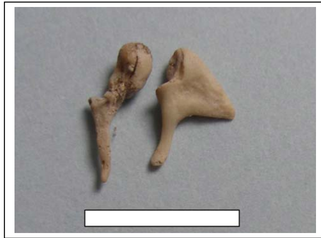
Figura 4.- Martillo y yunque

Yunque y martillo del derecho (Figura 4), y parte del anillo timpánico.