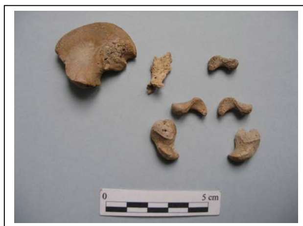
Figura 9.- Restos de pelvis.

Medidas: Longitud máxima derecho: 17'4 mm. Longitud máxima izquierdo: 16'6 mm. Longitud máxima izquierdo: 15'1 mm