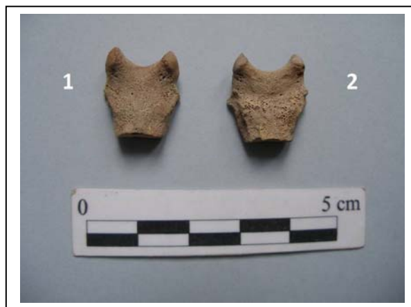
Figura 5.- Parts basilaris de ambos individuos

Medidas: Altura mínima (a): 13'4 mm. Anchura máxima (b): 15 mm. Altura máxima (c): 16'7 mm.