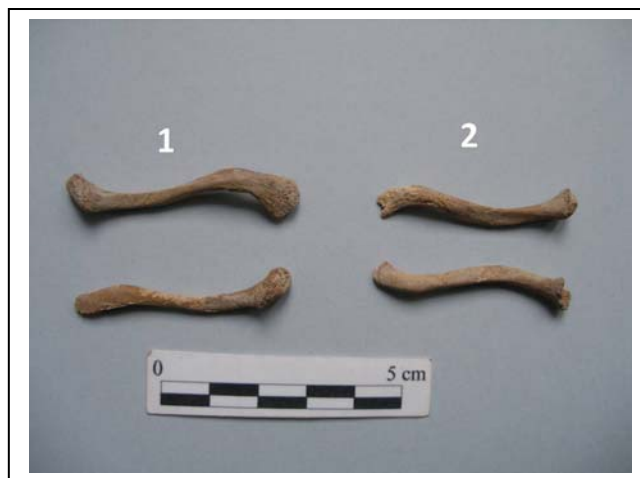
Figura 8.- Clavículas

Medidas: Anchura (b): 31'2 mm. Anchura de la espina (c): 35'2 mm. Clavícula izquierda (Figura 8). Longitud máxima (a): 47 mm.