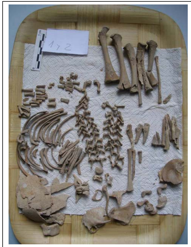
Figura 2. Proceso de limpieza y clasificación

2), constatando la presencia de algunos fragmentos de fauna (Figura 3) y cerámica, en el conjunto.