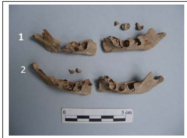
Figura 7.- Restos mandibulares de ambas inhumaciones