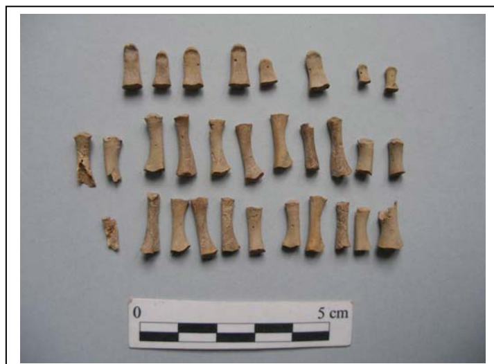
Figura 10.- Restos de manos y pies.