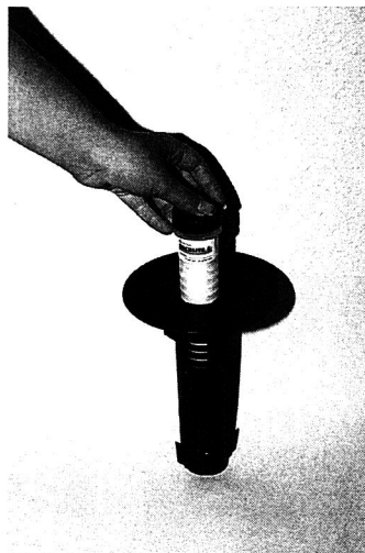
8. Estación colocada en el exterior