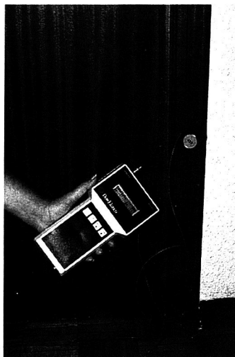
7. Detector Acústico de Sonidos