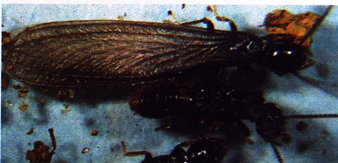
4. Alados: Vuelan en primavera para formar nuevas colonias

queño, se desprende poco a poco y un nuevo caparazón más grande se forma inmediatamente. Este proceso se llama muda. Las termitas mudan aproximadamente una decena de veces antes de lograr su tamaño definitivo.