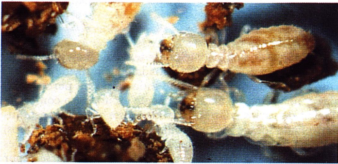
2. Termitas obreras: dos obreras alimentan a las larva mediante trofalaxia