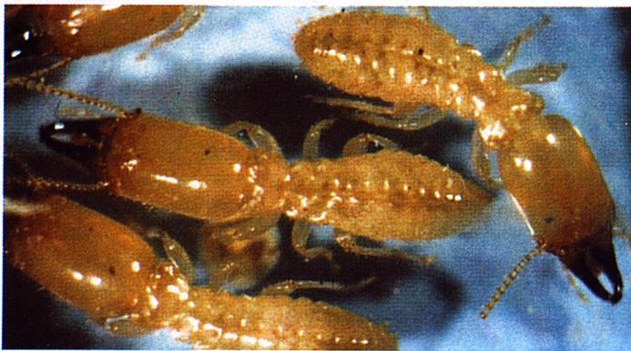
3. Soldados: dos soldados defienden la colonia