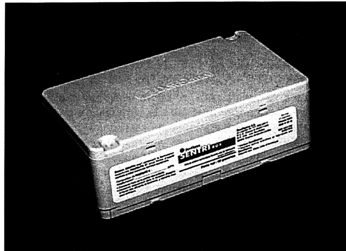
9. Estación que se coloca en el interior de los edificios

Según el tipo de construcción y la naturaleza de la actividad de las termitas, se pueden utilizar dos tipos de estaciones: