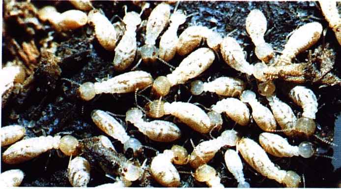
1. Termitas obreras