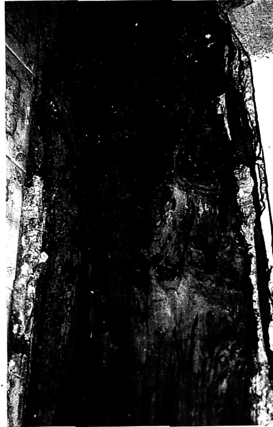
5. Daños en estructura

Las estaciones se colocan según recomendaciones técnicas específicas y teniendo en cuenta el comportamiento social y biológico de las termitas.