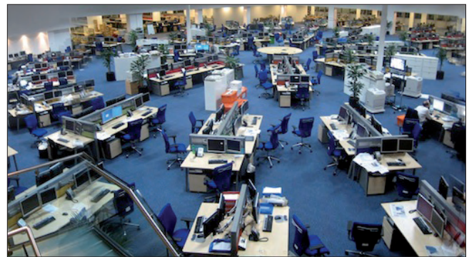
Ejemplo de convergencia en una redacción: Daily telegraph

La convergencia periodística –en sus vertientes tecnológica, empresarial, profesional y de contenidos– acapara en los últimos años buena parte del interés de los investigadores sobre ciberperiodismo. A diferencia de lo que ocurría en los años 90, estas investigaciones han superado la fase de dar carta de naturaleza a una nueva modalidad del periodismo, y han comenzado a estudiar las incipientes relaciones editoriales, logísticas y comerciales de los cibermedios con otras plataformas preexistentes.