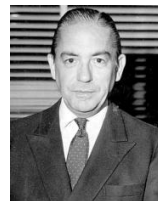
Gregorio Marañón Moya

http://www.unav.es/servicio/archivo/gomezaparicio