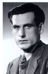
Rafael Calvo Serer

http://www.unav.es/servicio/archivo/perezembid