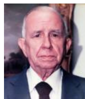
Manuel Lora Tamayo

http://www.unav.es/servicio/archivo/bravoydiazcanedo