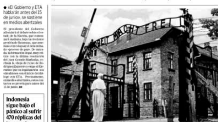
Como hijo del pueblo alemán... Batasuna presiona a Zapatero...