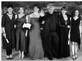
Cannes premia a las chicas de Almodóvar por 'Volver'