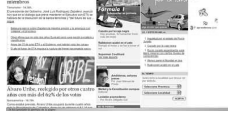
Como hijo del pueblo alemán... Batasuna presiona a Zapatero...