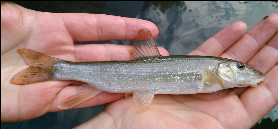
Fokozottan védett kárpáti-márna ( Barbus carpathicus) a Bán-patakából