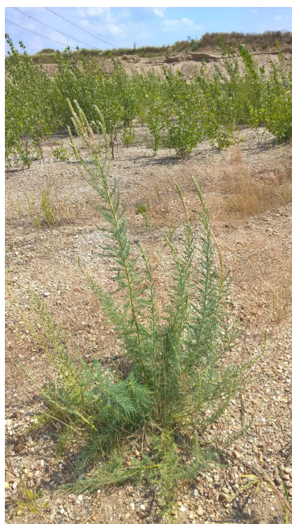
1. ábra. A csermelyciprus virágzó példánya Hejőpapi közelében, egy kavicsbányában

Ugyanakkor az előfordulás egyrészt jelzi a szél általi terjedés (anemochoria) hatékonyságát, hiszen a faj legközelebbi ismert lelőhelye (Rudabánya) légvonalban mintegy 60 km távolságra található (2. ábra), noha az sem kizárt, hogy a propagulum távolabbi