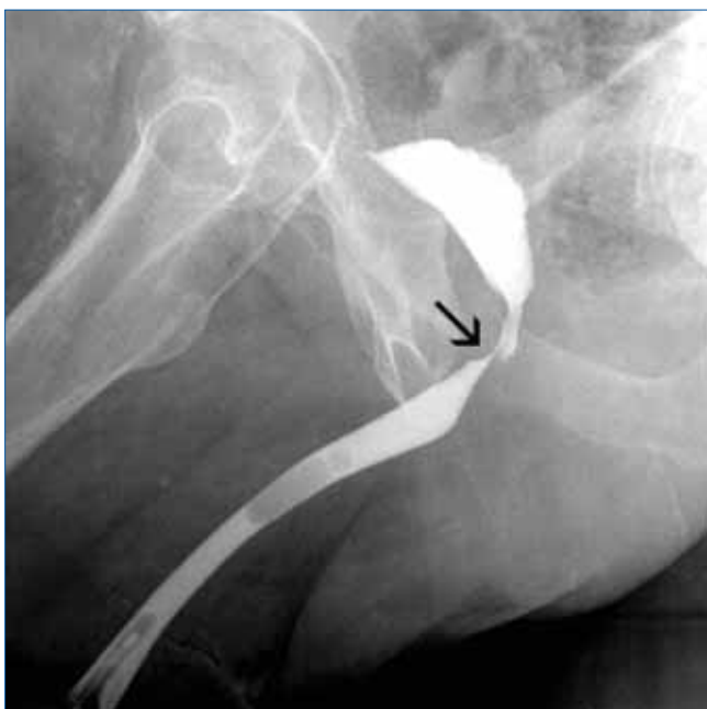
3. ÁBRA: A DIVERTICULECTOMIA UTÁN HÁROM HÉTTEL KÉSZÜLT RETROGRÁD URETHROGRAM EXTRAVASATIOT NEM MUTAT. A NYÍL AZ 1. KÉPEN IS LÁTHATÓ MEMBRANOSUS HÚGYCSŐSZAKASZT MUTATJA

csőtágulat (11, 12). Nem egyértelmű diagnózis esetében további vizsgálatok, mikciós uretrográfia, medence MR- és transrectalis UH-vizsgálat lehet a segítségünkre (5, 13).