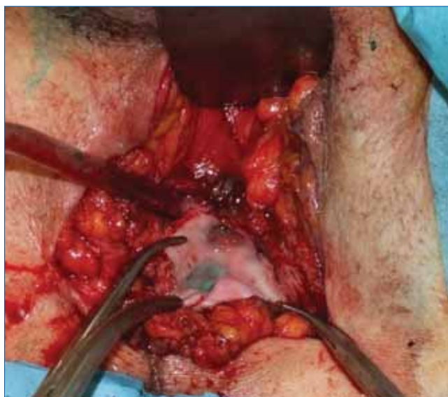
2. ÁBRA: HOSSZÁBAN BEHASÍTOTT DIVERTIKULUMZSÁK, AMELYBEN METILÉNKÉKKEL SZÍNEZETT FIZIOLÓGIÁS SÓOLDAT LÁTSZIK, AMELYET A DIVERTIKULUMNYAK AZONOSÍTÁSA CÉLJÁBÓL ADTUNK BE HÓLYAGKATÉTEREN KERESZTÜL

A férfi húgycsődivertikulumok 67-90%-a szerzett, ezek nagy része húgycsőszűkület, infekció és trauma következtében alakul ki