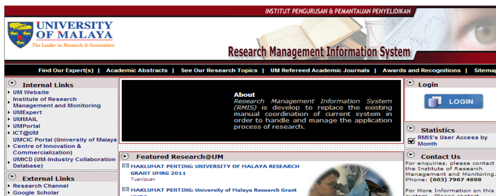
Rajah 3: Research Management Information System (RMIS)

Data penerbitan yang dimuat turun dalam EndNote akan dimuat naik ke Research Management Information System (RMIS) (Rajah 3) yang terkandung dalam UMEExpert untuk diakses oleh semua staf akademik yang mempunyai akaun UMEExpert. Staf akademik dapat mengemaskini CV mereka berkenaan penerbitan dengan merujuk senarai yang dimuatnaik oleh Perpustakaan (Rajah 4) sekiranya penerbitan tersebut sudah diindeks dalam ISI dan Scopus.