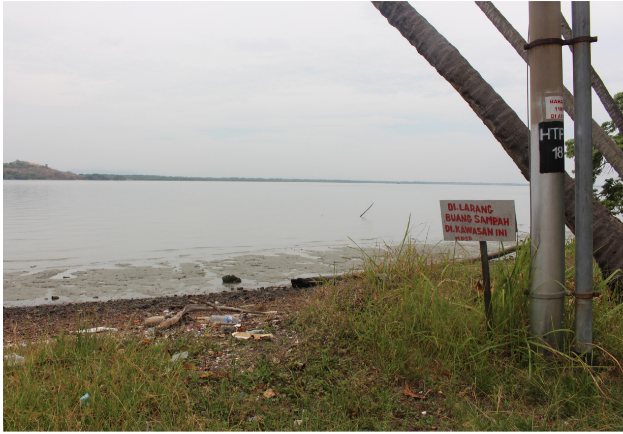
[BAWAH] Beting pasir yang menjadi tumpuan pengunjung yang datang ke Pulau Aman untuk bergambar dan juga memancing.