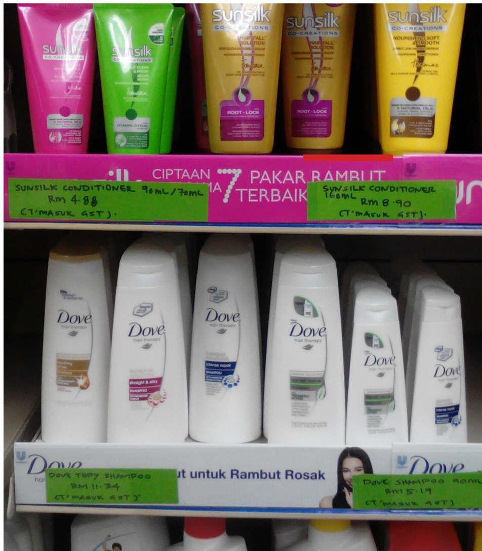
Sebahagian barangan di Koperasi USM yang dikenakan CBP. Kekeliruan berlaku apabila siswa-siswi tidak dapat membandingkan harga sebelum dan selepas barangan tersebut kerana telah disertakan sekali dengan jumlah CBP pada barangan tersebut.

"Siswa-siswi disarankan meminta resit bayaran semasa membayar di kaunter bagi mengetahui jumlah bayaran dan CBP yang dikenakan kepada mereka. Tidak semua barang dikenakan CBP, hanya yang tertentu sahaja", jelasnya lagi.