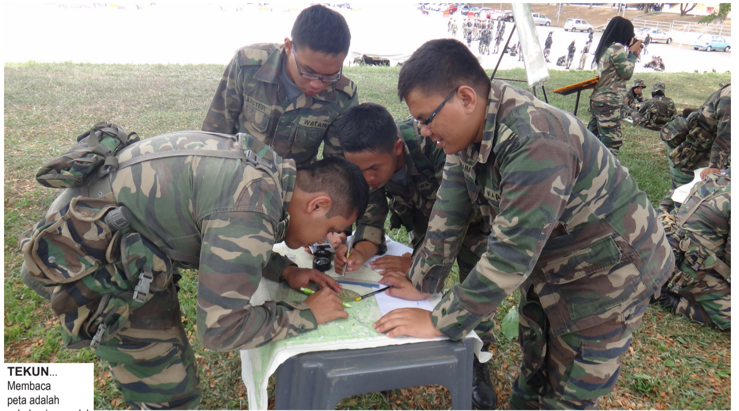
TEKUN... Membaca peta adalah sebahagian modul pelajaran pegawai kadet PALAPES Tentera Darat bagi memenuhi kriteria sebagai Pegawai Muda dalam Angkatan Tentera Malaysia (ATM).

Sementara itu, Beliau juga berkongsi bahawa Pusat