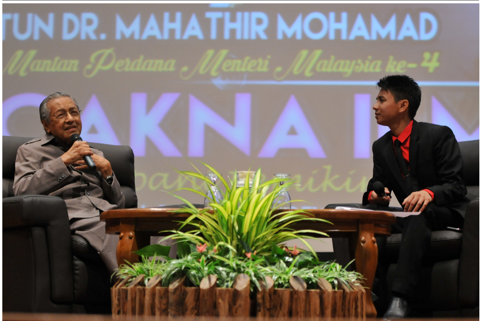
PADAT . . . Mantan Perdana Menteri Malaysia, Tun Dr Mahathir Mohamed (kiri) berkongsi ilmu bersama siswa-siswi Universiti Sains Malaysia (USM) dalam program Cakna Ilmu anjuran Majlis Perwakilan Pelajar (MPP) di Dewan Tuanku Syed Putra (DTSP) pada 30 April 2015. Lihat halaman 15 untuk berita selanjutnya.

Selain aduan dan komen melalui Facebook, kami juga perlu gunakan cara lain untuk maklumkan perkara ini.