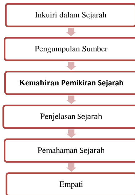
Rajah 2.1 Struktur Disiplin Sejarah

Teras Struktur Disiplin Sejarah diringkaskan seperti mana ditunjukkan di dalam Rajah 2.1.